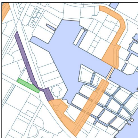
Forslag til ændret centerstruktur for detailhandel.