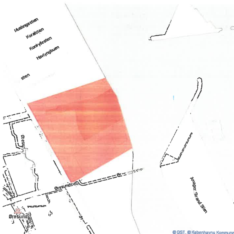
Figur 1. Det ansøgte område Sundby Havn på Amagers østkyst

Ansøgningen omfatter matr.nr. 3477, 3792, 4359, 4360, 4361, Sundbyøster, København, samt umatrikuleret areal. Der ansøges således om, at strandbeskyttelseslinjen frem over følger det nordlige skel af matr.nr. 145a, Sundbyøster, som vist på figur 2. Det samlede areal, der ansøges om (landareal ekskl. havnebassinet), er ca. 6,25 ha. Alle arealer tilhører Københavns Kommune.