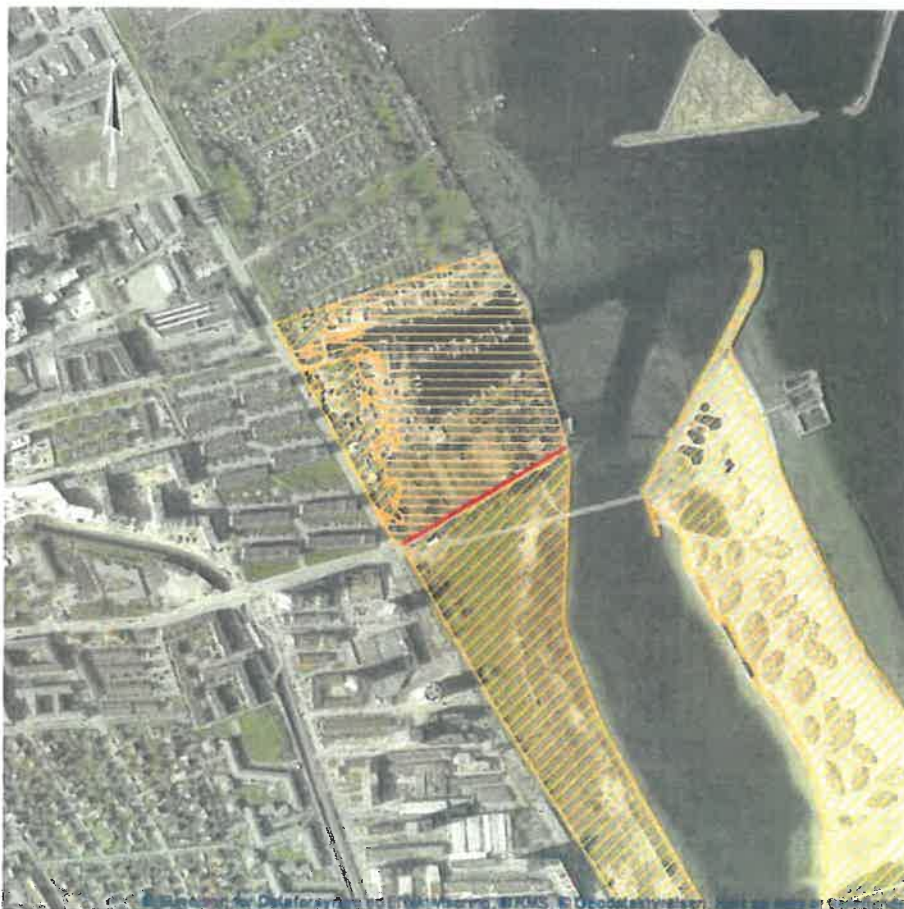
Figur 2. Ønsket nyt forløb af strandbeskyttelseslinje vist med rød linje i nordskel af matr.nr. 145a.

Havnen ligger i en bymæssig sammenhæng omgivet af bolig- og erhvervsbebyggelse, kolonihaver, andre rekreative funktioner mv. Det er kommunens vurdering, at området er omfattet af formålet med muligheden for at ophæve strandbeskyttelsen på og omkring havne.