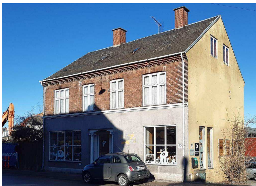
Valby Langgade 52