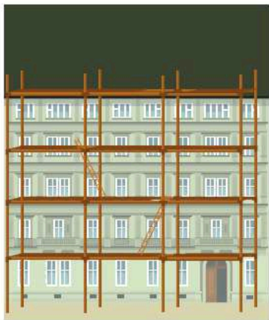
Åben facade uden stilladsreklame