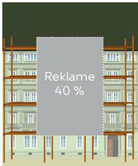
Åben facade med stilladsreklame