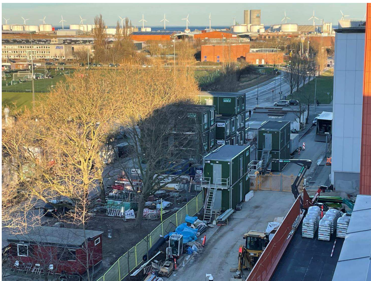
Billede 1: Skolens nærhed til trætoppe og Kløvermarken