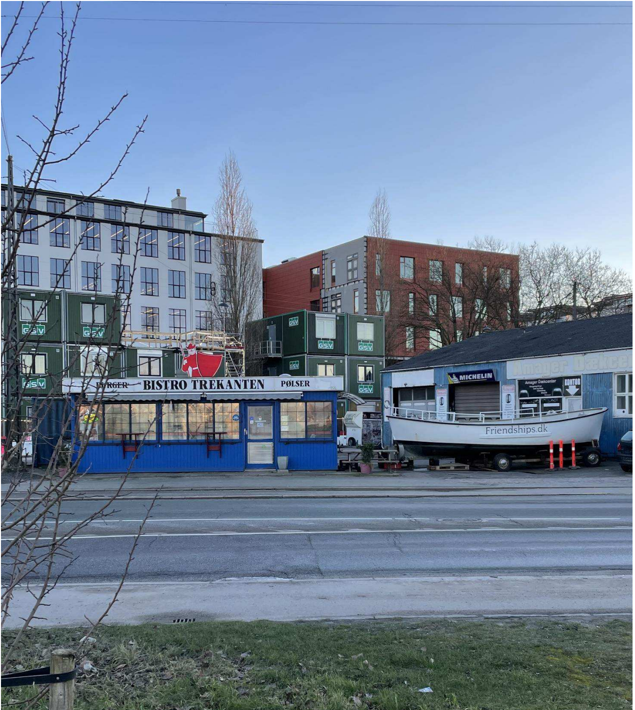
Billede 2: Linjeføring set fra Amagerbanen ved Upladsgade