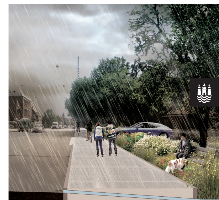
FORSLAG FRA TEKNIK- OG MILJØFORVALTNINGEN, JUNI 2014