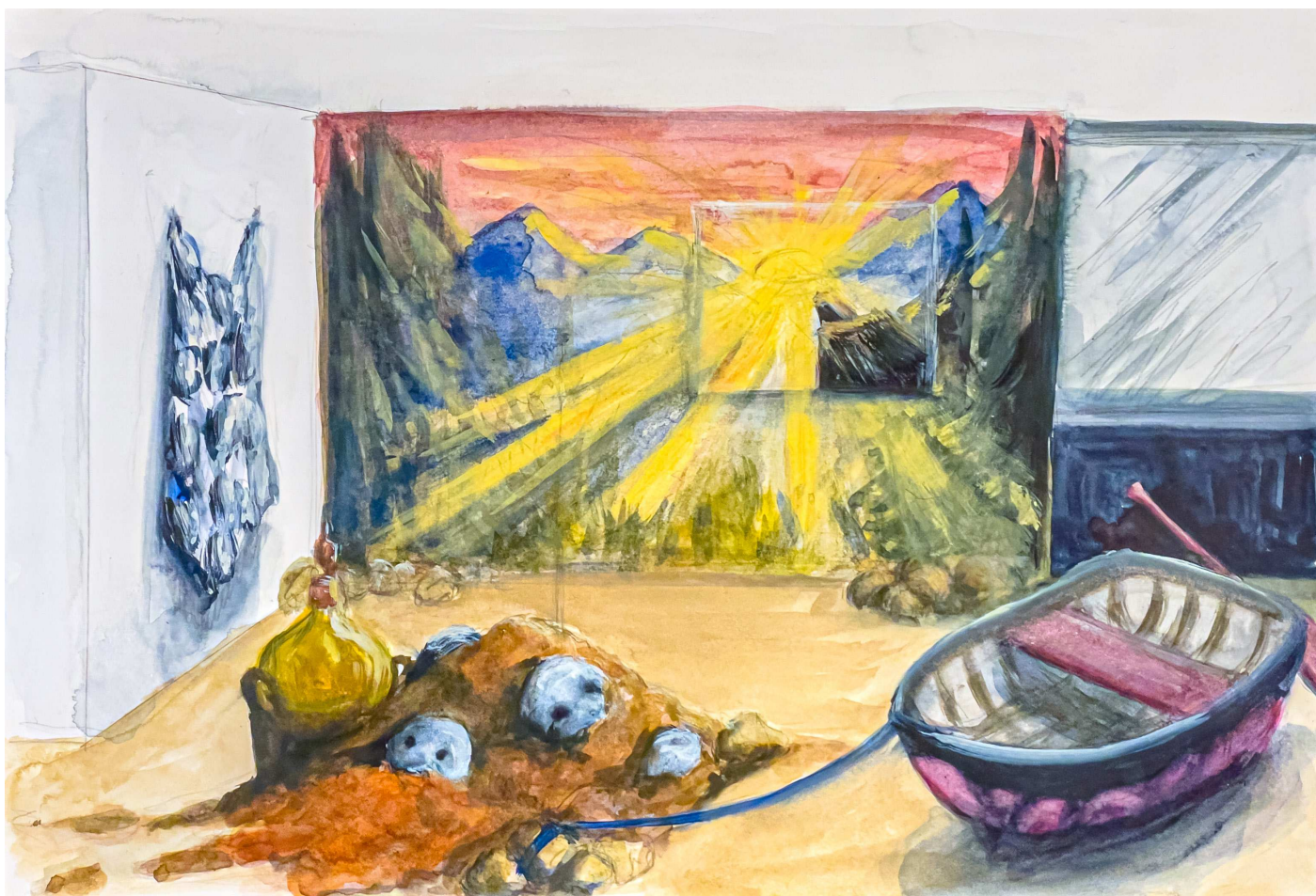
SPOR – Hvor kommer vi fra? Hvor skal vi hen?, skitse af udstilling på Sydhavn Station, Anne Skole Overgaard, akvarel, 30 x 21 cm

22. marts - 21 april Sydhavn Station & TITLED