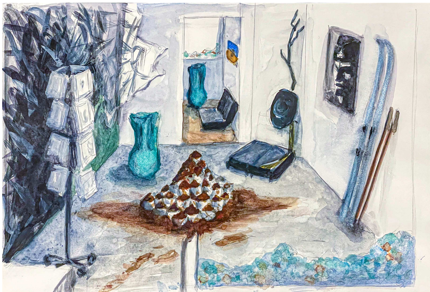
SPOR – Hvor kommer vi fra? Hvor skal vi hen?, skitse af udstilling på TITLED, Anne Skole Overgaard, akvarel, 30 x 21 cm

22. marts - 21 april Sydhavn Station & TITLED