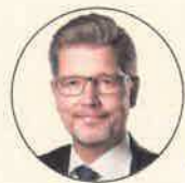
Frank Jensen Socialdemokratiet. Formand for Borgerrepræsentationen. Formand for Økonomiudvalget.