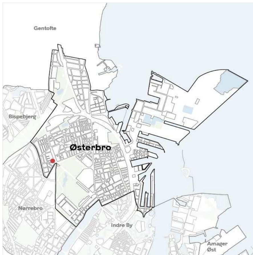
Områdets placering i bydelen.

Grundejer har haft et ønske om nedrivning af to byhuse på matr.nr. 3638, Udenbys Klædebo Kvarter, København, Aldersrogade 6A og 6B, med henblik på at opføre nyt byggeri med hotellejligheder. Byhusene fremgik af 'Liste over nedrivningssager til Teknik- og Miljøudvalget', som var en del af dagsordenen til møde i Teknik- og Miljøudvalget den 27. februar 2023. Teknik- og Miljøudvalget besluttede på mødet at