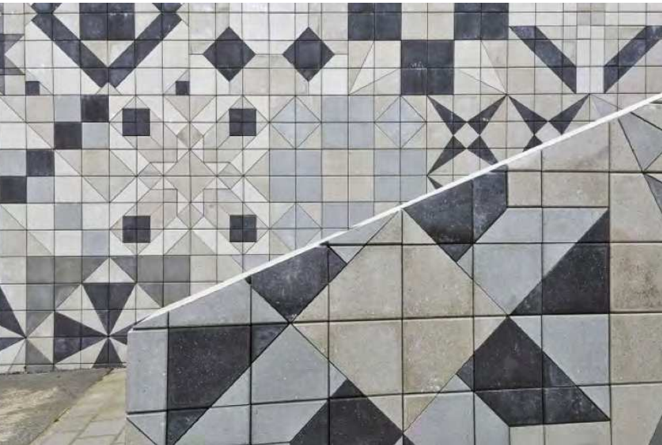
Mette Winckelmann Tro og Overtro, 2013

De to ovenfor nævnte eksempler viser forskellige kunstneriske greb, som hver på deres måde aktiverer den lokale, stedsspecifikke fortid. Fælles for dem er grundig research og interesse i at skabe forståelse og indsigt i den lokale historie gennem henholdsvis midlertidige og permanente markeringer med stærke narrative elementer.