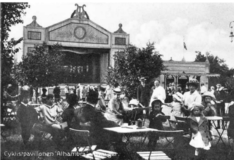
Amagerbrogade ved Sundbyvester Plads omkring 1910. Forlystelsesstedet Alhambra Park. Postkort udlånt af Sundby Lokalhistoriske Forening og Arkiv

Omdannelsen af Sundbyøster Plads skal afstemmes med planerne for sportshallen på pladsen. Sportshallens aktiviteter tænkes sammen med kommende aktiviteter i forbindelse med nye indkøbsmuligheder på pladsen. Derfor er det en plads, som potentielt rummer mere aktivitet og liv. Lokaludvalgene har i forbindelse med omdannelsen af pladsen yttret ønske om, at gavlen på Sundbyøster Plads bliver inddraget som en del af det strategiske arbejde med kunst på Amagerbrogade. Frem for at placere et permanent værk på gavlen kunne det være en idé at udfordre grænserne for, hvordan byer traditionelt set arbejder med kunst på gavle, dvs. eksperimenterer med gavlundsmykningen som genre og format. Man kunne fx iværksætte et forløb af værker, der udskiftes, som man bl.a. har gjort langs det gamle jernbanespor High Line i New York. Man kunne også arbejde med tekster på gavlen, f. eks. Klaus Rifbjerg og nulevende forfattere, som er bosiddende på gaden.