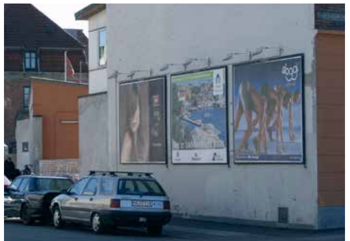
Billboards kan opsættes på brandgavle i industriområder og på byggepladshegn.