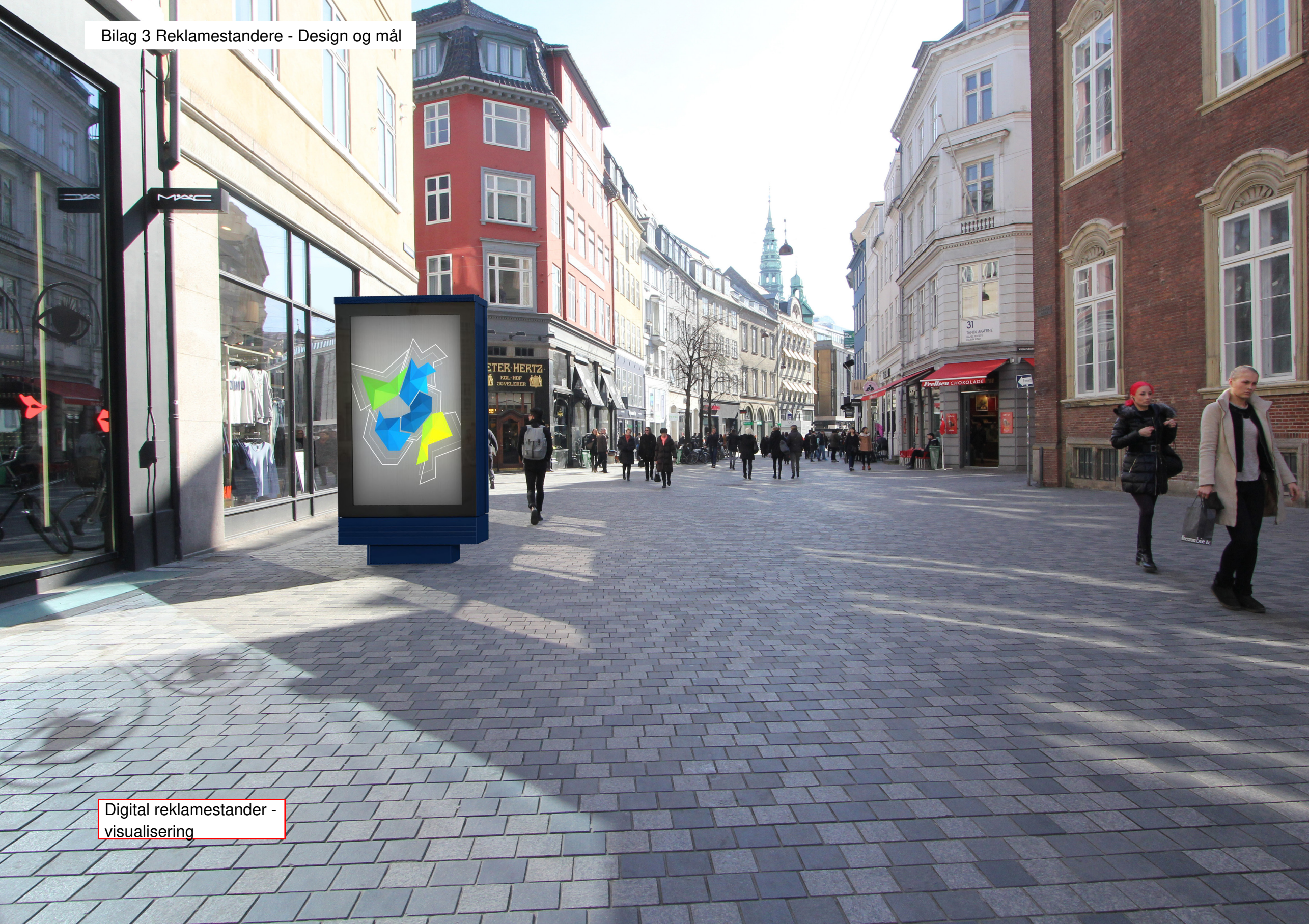
Digital reklamestander - visualisering