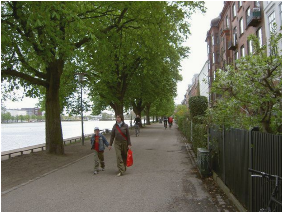
Illustration 17: Sortedams Dossering.

Status: Der har kun været beskeden aktivitet, primært i kraft af at deltagelse i Miljøtrafikugen faldt til jorden.