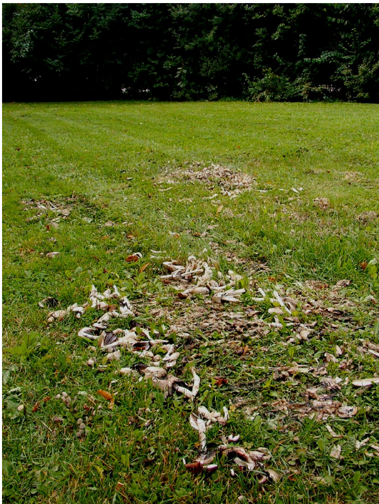
Illustration 14: En klynge blækhatte er faldet som offer for græsslåmaskinen i Amorparken.

Status: Det ser ud til at lykkes at sætte en række væsentlige ”grønne” fingeraftryk i udviklingsplanen for Fælledparken. Ovennævnte forslag til permakulturpark på Svanemøllen Kasernes areal er en knopskydning på denne aktivitet.