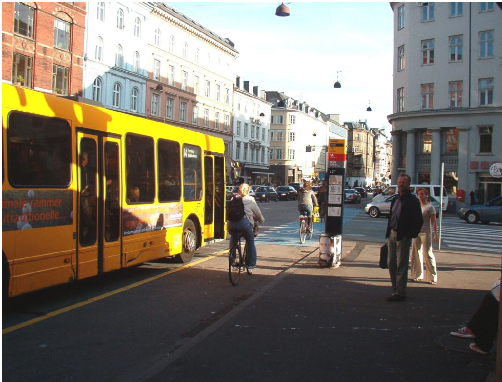
Illustration 15: Trianglen er et af Østerbros vigtigste trafikknudepunkter.