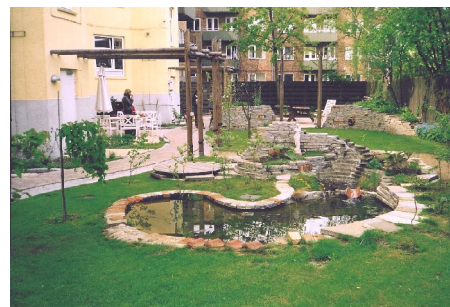
Illustration 12: Et af de besøgte gårdanlæg var dette på Thomas Laubs Gade, som er lavet under ledelse af Byhavenetværket.

Erfaringer: Det var en fordel, at både Grønne Gårde og Byhavenetværket deltog, idet det tillod at vise en større spændvidde i de mulige tilgange til anlæg af grønne gårdanlæg.