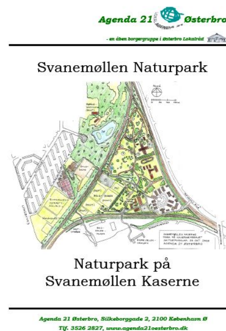
Illustration 13: Forsiden af Agenda 21 Østerbros udførlige debatoplæg.

Status: Opfyldt. Skitseprojektet blev præsenteret på et debatmøde om den planlagte vejforbindelse mellem Lyngbyvejen og Nordhavnen.