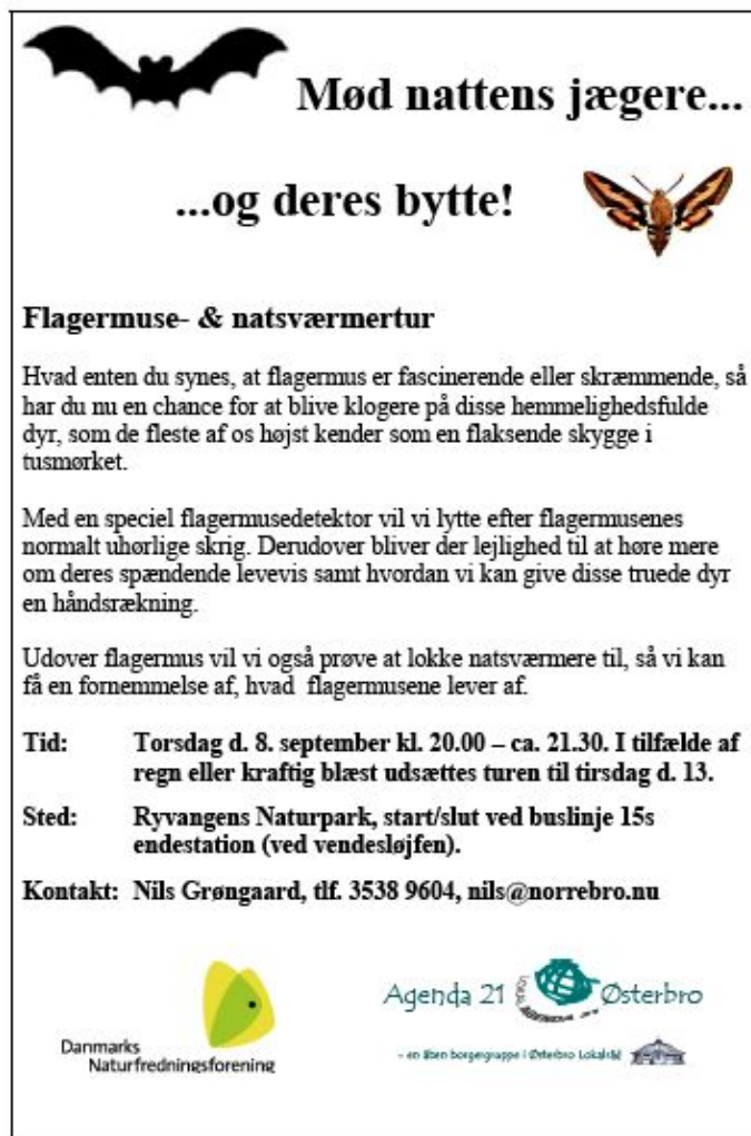
Illustration 19: Opslag om naturvandring.

Ang. nyhedsbrevet har det givet en del ”kunder i butikken” til satellittens aktiviteter, men dog ikke så mange som man kunne have ønsket. Nyhedsbrevet har dog også fra start været tænkt som en mere langsigtet, fastholdende indsats mhp. at mindske risikoen for at interesserede ”falder fra” igen, og dets effekt bør derfor primært måles over flere år. Da første nyhedsbrev udkom i september 2004 (og nyhedsbrevet først gradvist fandt sin nuværende form) er det således for tidligt at vurdere effekten endeligt.