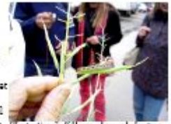
Illustration 5: Kållarve - bemærk de store stulper med langt "mab" på planten, der er et af Naturvandrings på Øster Allé. Juni 2004.

Alle korsblomster er i princippet spiselige, så du kan selv prøve dig frem, og finde ud af hvad du kan lide i større eller mindre mængder. Helt generelt gælder det, at de unge, små planter og blade er bedst, mens de store blade og blomstrende planter som regel er både seje og meget bittere skarpe. Derudover er regel nr. 1, at alle skal skylles grundigt, inden det kommer i munden, da man ellers udsætter sig for alskens kedelige bakterieinfektioner i form af indvoldorme, bakterier, m.m.