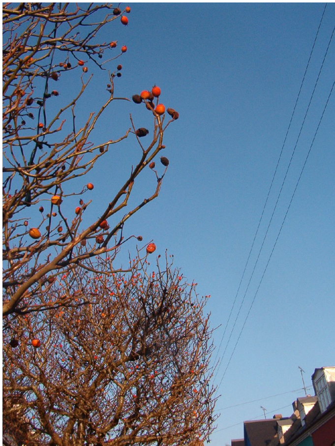
Illustration 20: Selje-røn, Olufsvej.

På det mere detaljerede niveau har satellitten udmøntet denne strategi i de fire ovennævnte indsatsområder. I det følgende gøres en kort opsummerende status over de opnåede resultater for aktiviteterne under hvert indsatsområde.