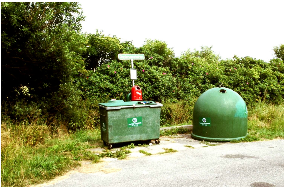
Illustration 6: Agenda 21 Østerbro siger "ja tak!" til en genbrugsplads, men den må meget gerne være lidt større end den i Stenbjerg, Thy.