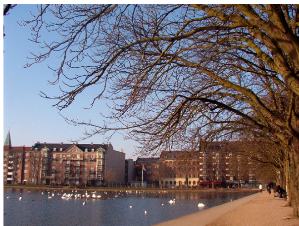
Illustration 9: Sortedams Sø: Promenaden langs Østerbrogade.

Status: Det lykkedes ikke at følge tilfredsstillende op på borgerdialogen pga. manglende kræfter blandt de involverede aktive. Derimod blev ideerne formidlet effektivt videre igennem en stor artikel i Berlingske Tidende d. 6/1 2005 samt på et offentligt møde om de indre søers fremtid arrangeret af Københavns Kommune. Københavns Kommune har modtaget Agenda 21 Østerbros indspil positivt og arbejder videre med dem.