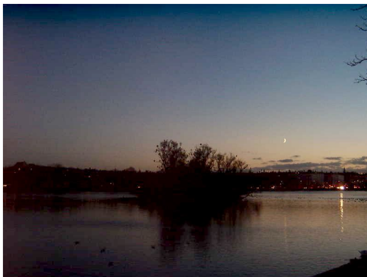
Illustration 21: Sortedams Sø med Fugleøen.

Bestyrelsen for Agenda 21 Center Indre Nørrebro – se næste side!