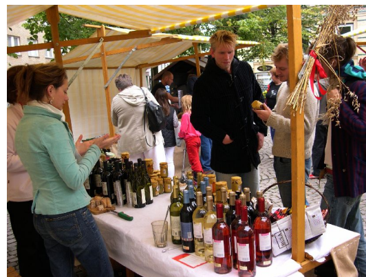
Illustration 7: De grønne torvedage er bevis på, at livskvalitet og bæredygtighed passer som hånd i handske.

Status: Østerbro Markedslaug er blevet dannet og torvedagene videreført trods bortfaldet af de fondsmidler fra Byøkologisk Fond, der bidrog afgørende til økonomien i 2004. Torvelauget arbejder videre på at konsolidere de grønne torvedage som en tilbagevendende begivenhed på Østerbro.