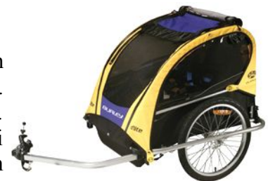
Illustration 16: Agenda 21 Østerbros sammenklappelige cykelanhænger vejer under 10 kg. men kan rumme to børn eller 45 kg.

Status: Gennemført, men der har ikke været større interesse for tilbudet, hvilket formentlig afspejler for lidt PR samt at anhængerens først var klar til udlån i efteråret, hvilket nok har kølnet interessen.