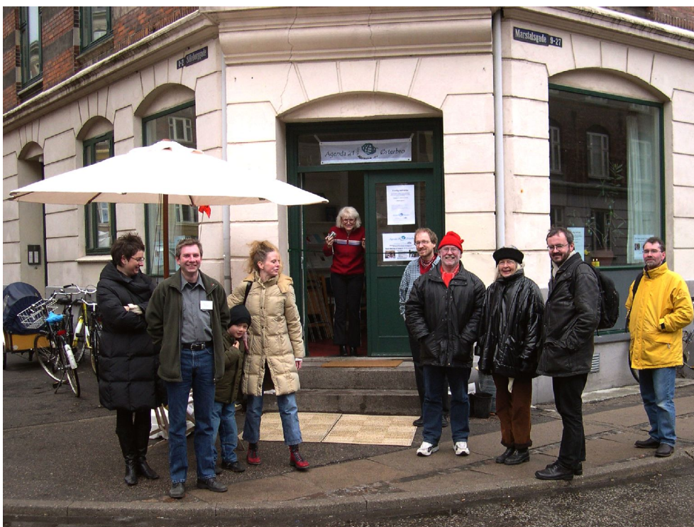
Illustration 2: Indvielsen af Agendabutikken d. 12. marts 2005 med besøg af Miljøborgmester Winnie Berndtson.

Baggrunden for udflytningen til Østerbro var et ønske om at komme tættere på den vigtigste målgruppe for satellittens arbejde, altså østerbroerne. Der blev derfor indført 3 x 3 timers ugentlig åbningstid i Agendabutikken i Silkeborggade, ligesom der er blevet arbejdet på at vække forbipasserendes interesse med små vinduesudstillinger, opslag om aktuelle aktiviteter, m.m.