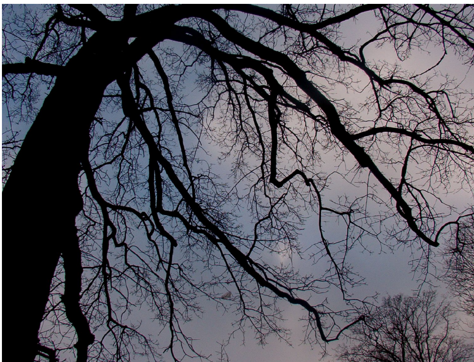
Illustration 8: Egetræ, Ryvangens Naturpark.