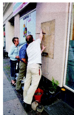
Illustration 10: Der arbejdes på Nøjsomhedsvej...

Status: Gennemført ad to omgange, ialt udleveret hhv. 16 og 34 planter. Den begrænsede efterspørgsel er kommet bag på satellitten. Medvirkende årsager er muligvis, at kampagnen kom sent i gang i forsommeren, og således måske blev ”ferieramt” i nogen grad, dels at det først senere end planlagt lykkedes at få presseomtale af kampagnens anden runde. Gentages i 2006.