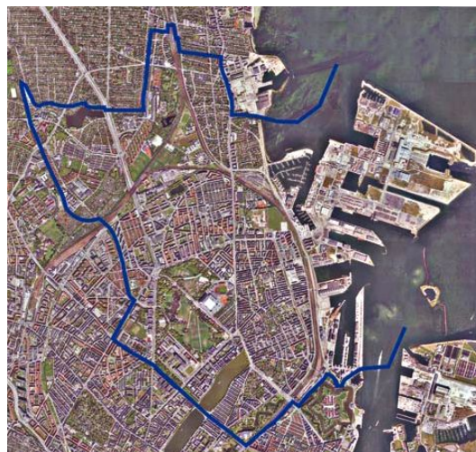
Illustration 1: Østerbro.

Ansøgningen blev imødekommet og i foråret 2003 blev agendacentret samt satellitten etableret. Formelt dækker satellitten alene Indre Østerbro, men holdningen i Agenda 21 Østerbro har hele tiden været, at Østerbro udgør et samlet hele, hvorfor satellitten i sit arbejde ikke har skelet til, hvor grænsen mellem Indre og Ydre Østerbro går.