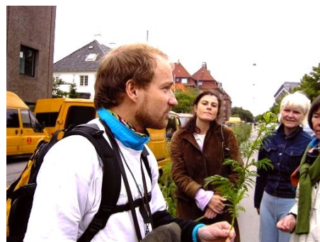
Illustration 11: Rabatten på Øster Allé er meget rig på planter. Her er det historien bag rejnfanens mærkelige navn, der fortælles.

Status: Gennemført med deltagertal svingende fra 1 (maj) til 40 (september). Taget i betragtning, at deltagertallet svinger stærkt, anses årsplanens succeskriterium samlet set for opfyldt. Turene er den aktivitet, der har givet klart flest abonnenter på Agenda 21 Østerbros nyhedsbrev. Udover flagermuseturen var smådyrsfangsten i Fælledparken samt ukrudtssafarien i Brumleby de største publikumsmagneter. Nøglefaktorerne vurderes at være presseomtale, muligheden for fælles familieaktivitet, samt emnerne som var enten ”spektakulære” (fx. flagermus) eller helt konkret nærværende (Brumleby). Derimod synes vejret kun at spille en mindre rolle, medmindre ekstreme forhold gør sig gældende.