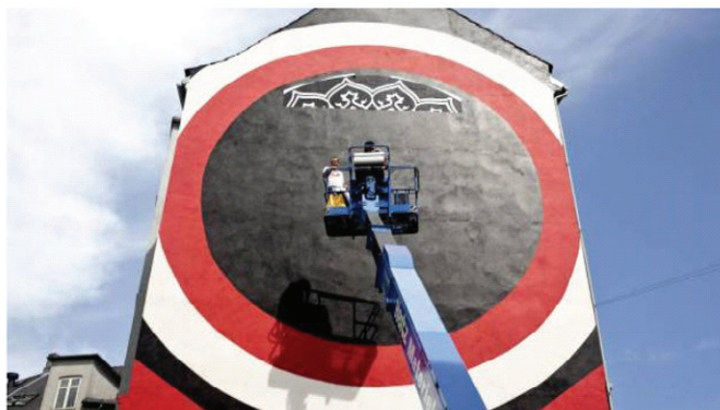
RIP. Den verdenskendte billedkunstner Shepard Fairey betegner sig selv som fredsaktivist. I går skabte han kunst på Ungdomshusets tidligere adresse i håb om, at den måtte hvile i fred.

Amerikansk kunstner forvandlede i går den ryddede grund til et kunstværk.