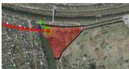
Enghave Kanal (det med rødt markerede areal)

Når skybrudstunnellen er færdiganlagt, vil der – udover en teknikbygning på ca. 90 m 2 ved Enghave Kanal – være en mindre teknikbygning ved Høffdingsvej. Der vil være dæksler i terræn og udluftningskanaler ved alle 4 skakter. Den præcise placering er endnu ikke fastlagt.