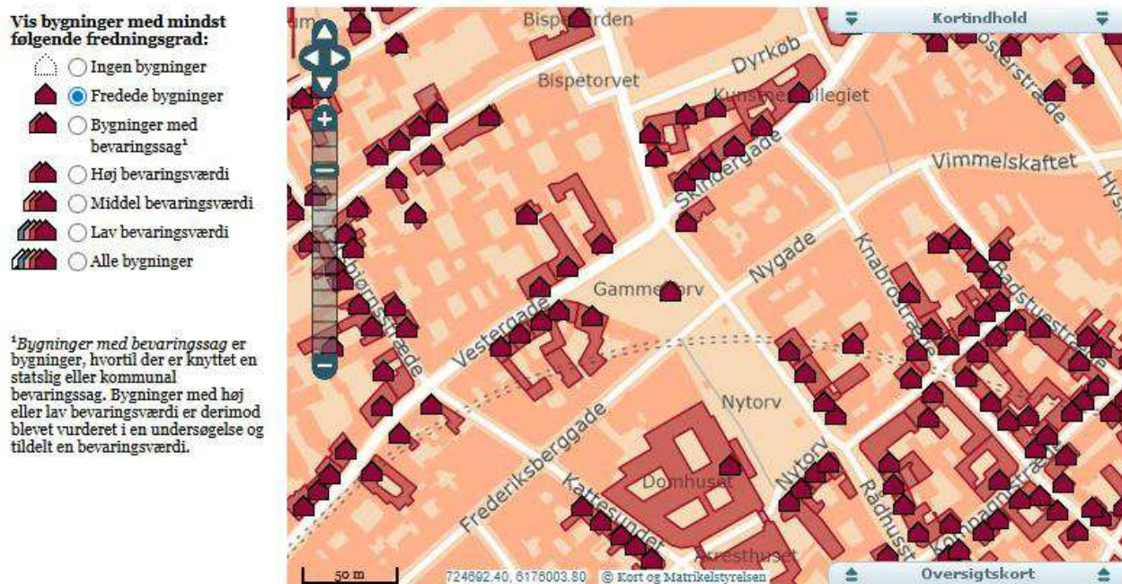
Uddrag fra "Fredningslistens kort over fredede ejendomme" på Gammel Torv og Nytorv.