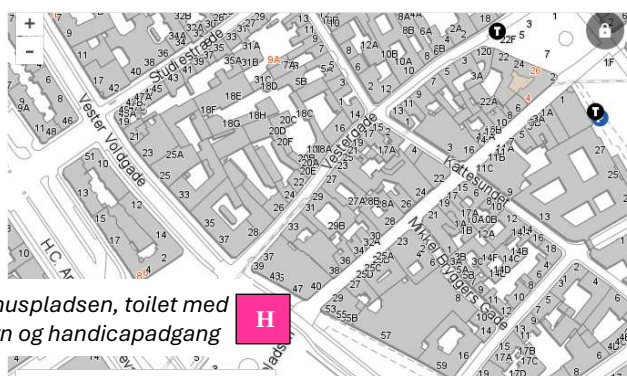
Kort tilknyttet forslag 2:

Gode toiletfaciliteter til nattegæsterne i Vestergade. Central placering i færdselsåren. I overensstemmelse med lokalplan 480. Anvend nedlægningen af søjlen på Gammel Torv til at finansiere opsynet på toiletterne på Rådhuspladsen. Alternativt, tilbyd gebyr fra restauratørerne for kollektive toiletfaciliteter.