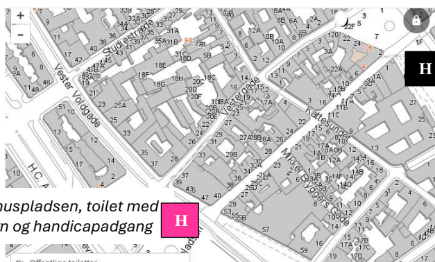
Kort tilknyttet forslag 1: