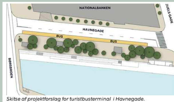
Skitse af projektforslag for turistbusterminal i Havnegade.

(...) Mange af gaderne i Københavns ældste bydele er smalle og bruges i høj grad af fodgængere og cyklister. Det gør det svært for store køretøjer som turistbusser at manøvrere i disse bydele, og det skaber utryghed og gener for gadernes øvrige trafikanter. I højsæsonen kan det også bidrage til trafikale flaskehalse på hovedfærdselsårer. Der etableres derfor en ny turist- busterminal på Havnegade ved Nationalbanken ved at nedlægge de eksisterende p-pladser. (...) Der er et stort potentiale for at generere mere byliv på stedet end i dag, da kajkanten ligger godt i forhold til solretningen og giver mulighed for at fortsætte havnepromenaden med siddemuligheder.