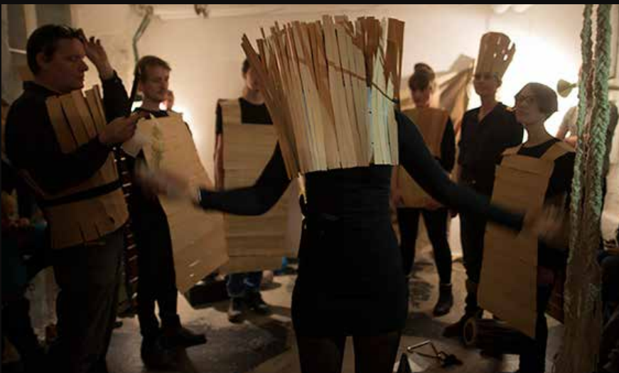
Fig 1 : Titel: Bogspiral - shaman, Materialer: bøger. Produktionsår: 2017. Dimensioner: 45x200x200 cm.