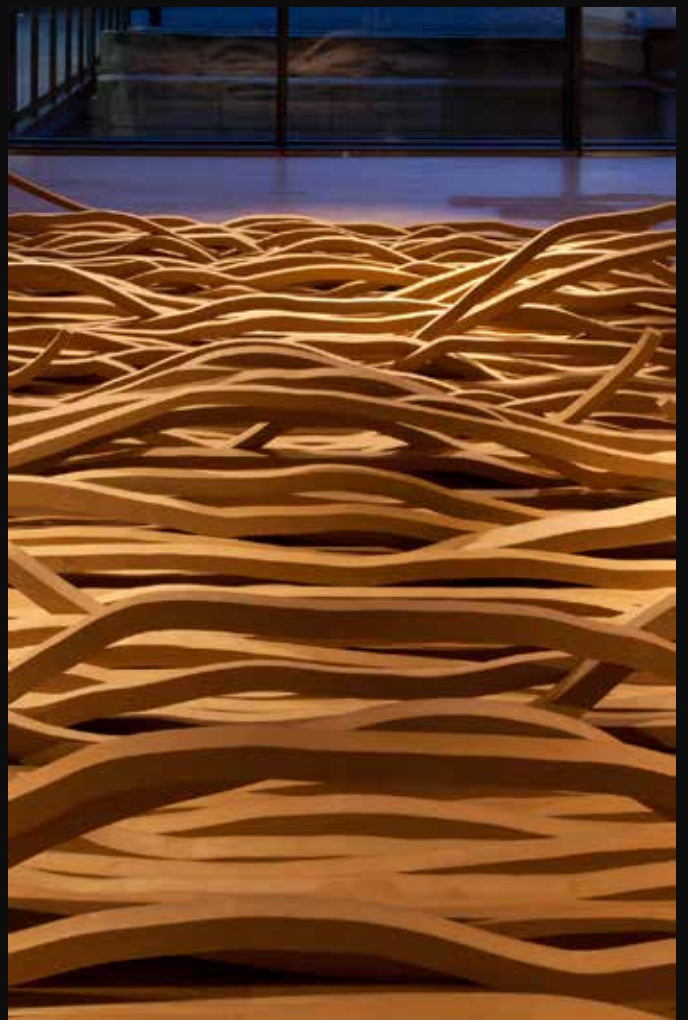
Fig 1+2 : Titel: Kontrolvæg. Materialer: birkefinér. Produktionsår: 2011. Dimensioner: 250x550x150 cm. Fig 3 : Titel: Pandora. Materialer: HDF, fiskesnørre. Produktionsår: 2011. Dimensioner: 90x90x1,2 cm. Fig 4 : Titel: Erindring. Materialer: MDF. Produktionsår: 2011. Dimensioner: 550x240x100 cm.