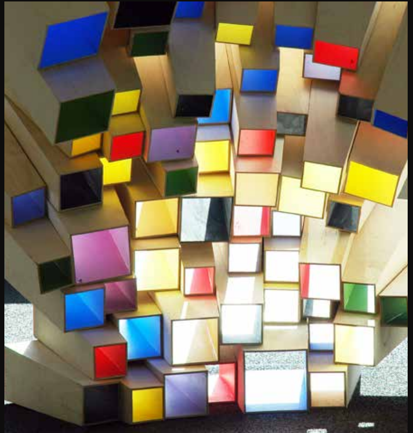
Fig 1 : Titel: Purple Snakes, performance på Roskildefesitval. Materialer: silkebånd, fløjlsbånd Produktionsår: 2018. Lyd: sang, theremin, metronom Fig 2 : Titel: Minde om vold. Materialer: birkefinér, oliemaling, alkydmaling. Produktionsår: 2014. Dimensioner: 315x210x210 cm. Fig 3 : Titel: Uden titel. Materialer: birkefinér, oliemaling Produktionsår: 2018. Dimensioner: 185x350x200 cm. Fig 4 : Titel: Kontrol. Materialer: birkefinér, oliemaling Produktionsår: 2009. Dimensioner: 150x200x100 cm.