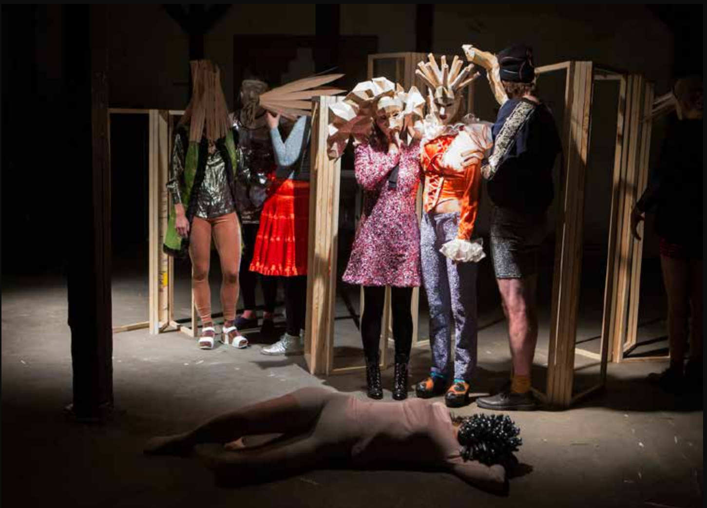
Fig 1-6 : Titel: Masker. Materialer: birkefinér. Produktionsår: 2015-17. Dimensioner: Ca.35x35x20 cm.