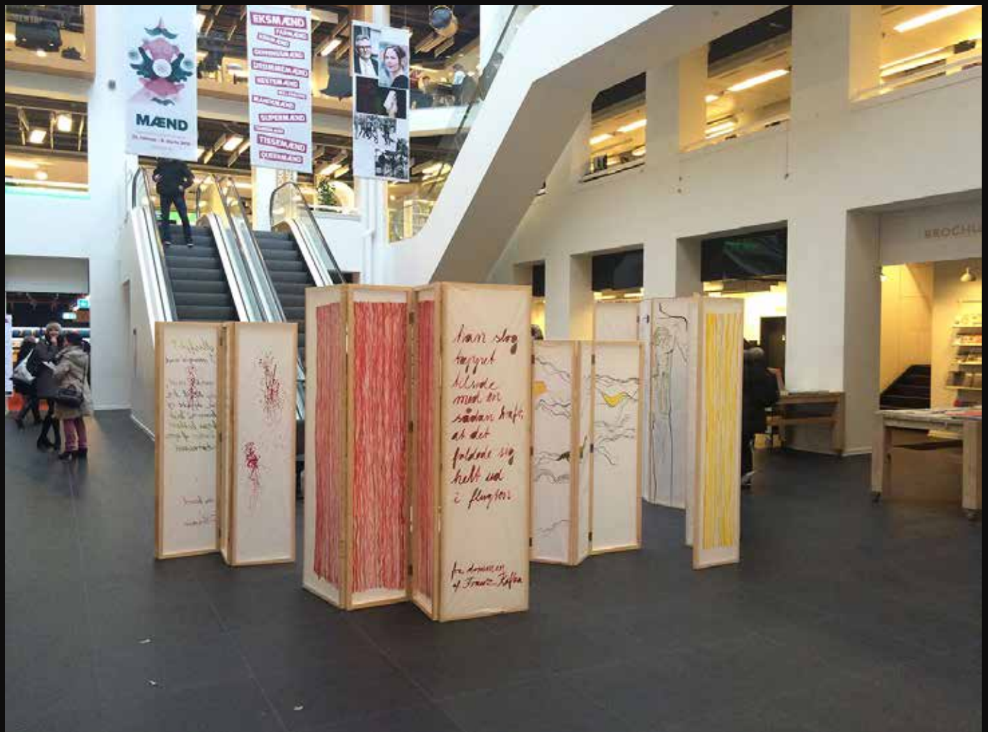
Fig 1 : Titel: Træfolkets lyd (performance). Materialer: bøgefinér, masker, hjemmebyggede violiner. Produktionsår: 2017.