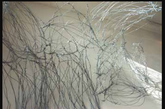
Fig 1+2 : Titel: Kvreteikreijji (performance). Materialer: ledninger, hønsenet, mixer, mikrofoner. Produktionsår: 2017.