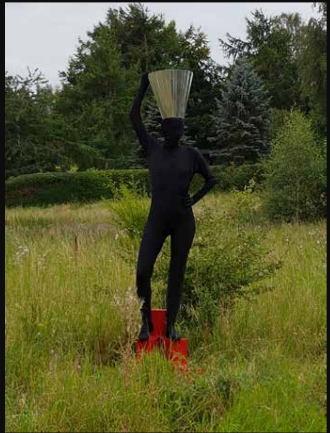
Fig 1-4: Titel: Foranderligt Privat + Spillet (installation / landart / performance). Materialer: jern, aluminium, secondskins, metalmalning, eksisterende træ, mos, jord, græs. Produktionsår: 2016.