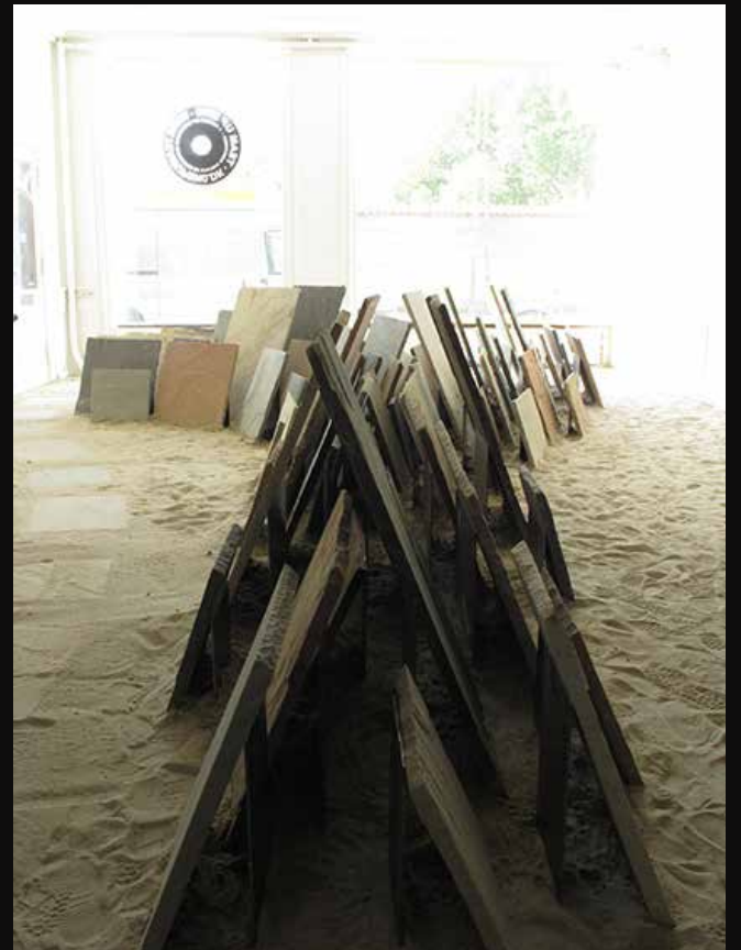
Fig 1+3: Titel: Forsvindingskabinet. Materialer: birkefinér, zink, lydabsorberende tekstil, elpære. Produktionsår: 2014. Dimensioner: 210x110x110 cm. Fig 2: Titel: Sindsvæggen. Materialer: kalkepapir, nylonsnor. Produktionsår: 2010. Dimensioner: 300x300x25 cm. Fig 4: Titel: Split. Materialer: sten, jern. Produktionsår: 2010. Dimensioner: 150x800x500 cm.