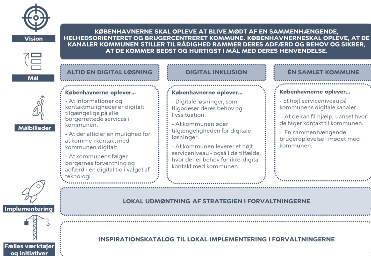
Figur 1. Service- og kanalstrategiens strategiske ramme