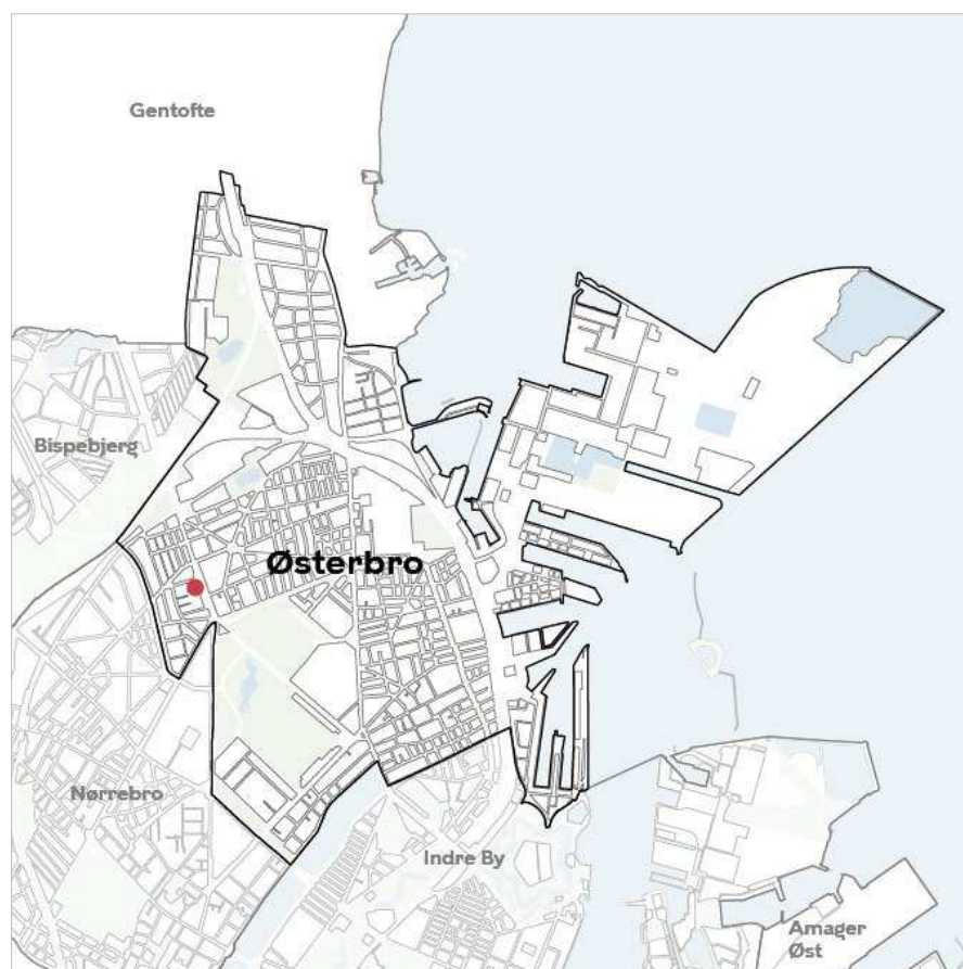
Områdets placering i bydelen.

Klima og Byudvikling Område for Byplanlægning Njalsgade 13 2300 København S