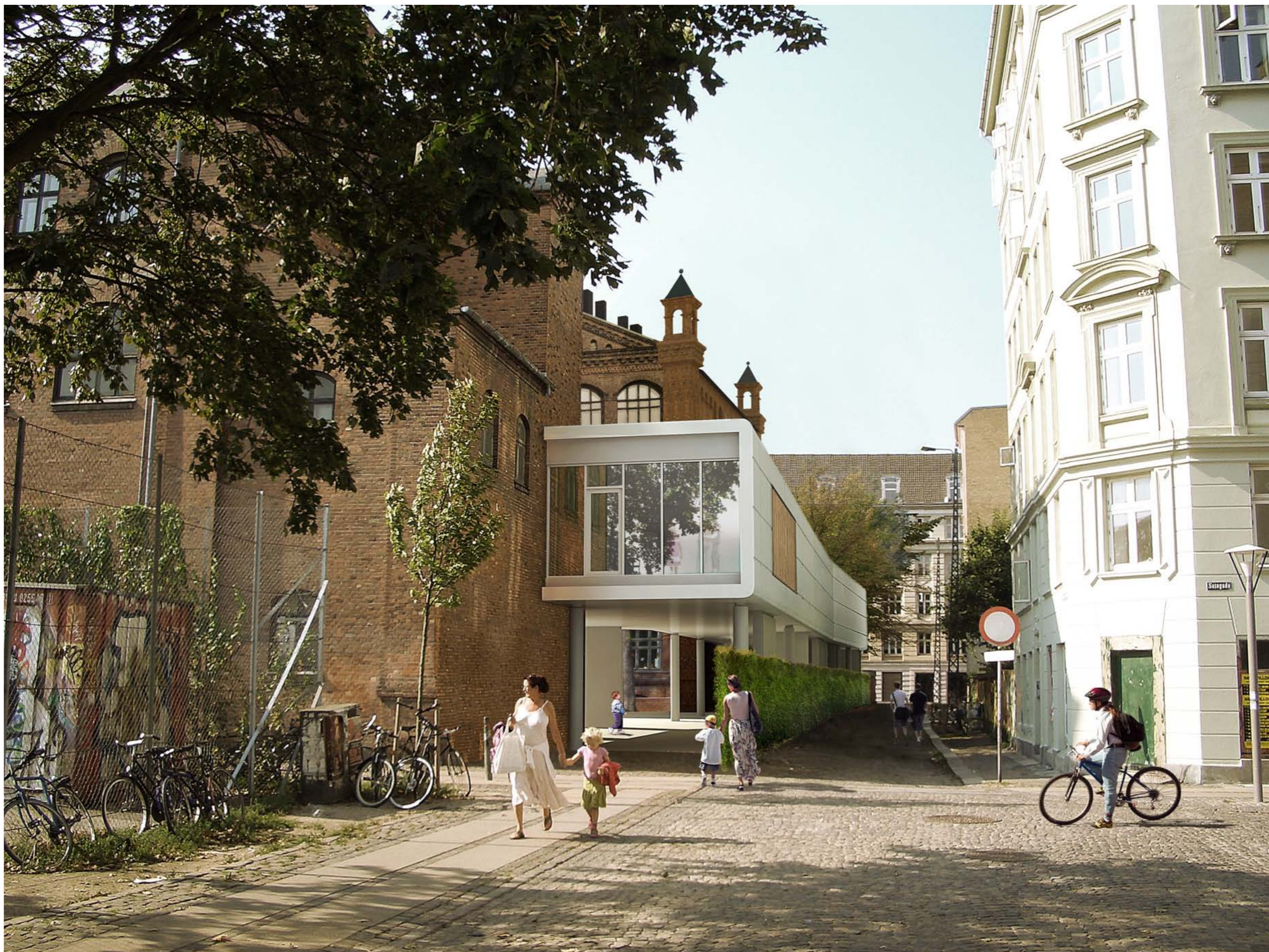
Perspektiv fra Litauens Plads