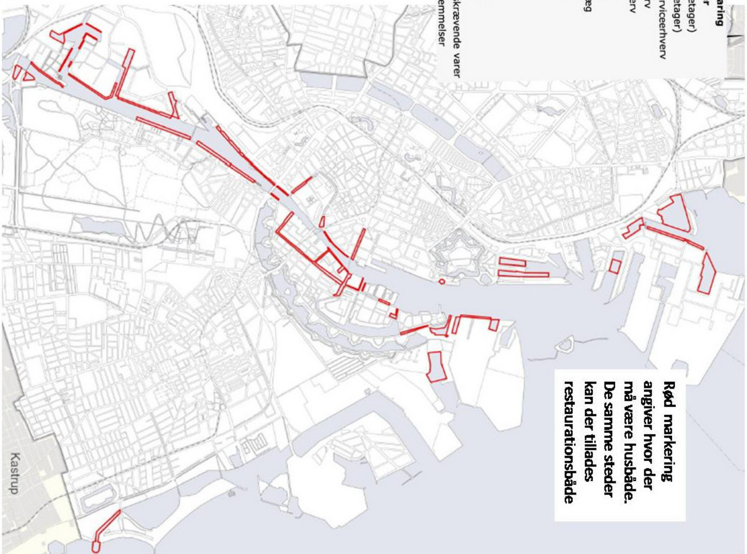
Rammekort - husbåde, V-ramme