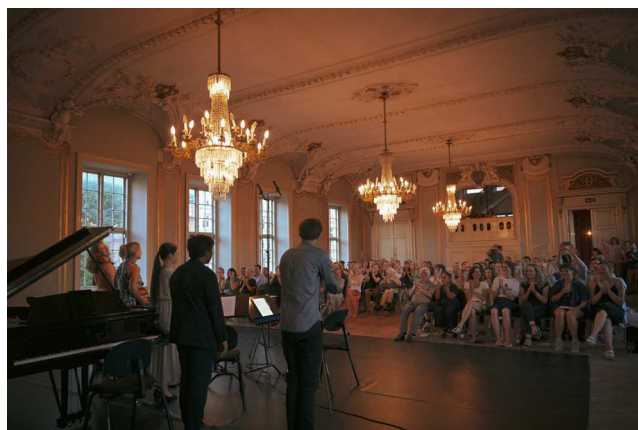
KLAVERKVINDET af Amy Beach, 2022 Musikere fra festivalensemblet tager bifald efter danmarkspremiere på Amy Beachs Klaverkvintet, mere end hundrede år efter den blev skrevet.