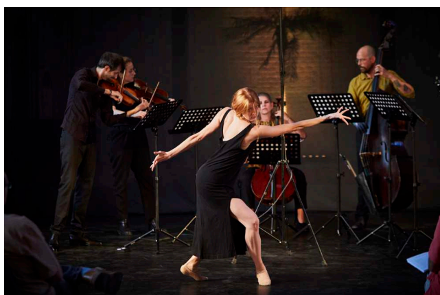
LULLABY & DOINA af Osvaldo Golijov, 2022 Danser Joscelyn Dolson sammen med musikere fra festivalensemblet til koncerten Jewish Voices i KoncertKirken.