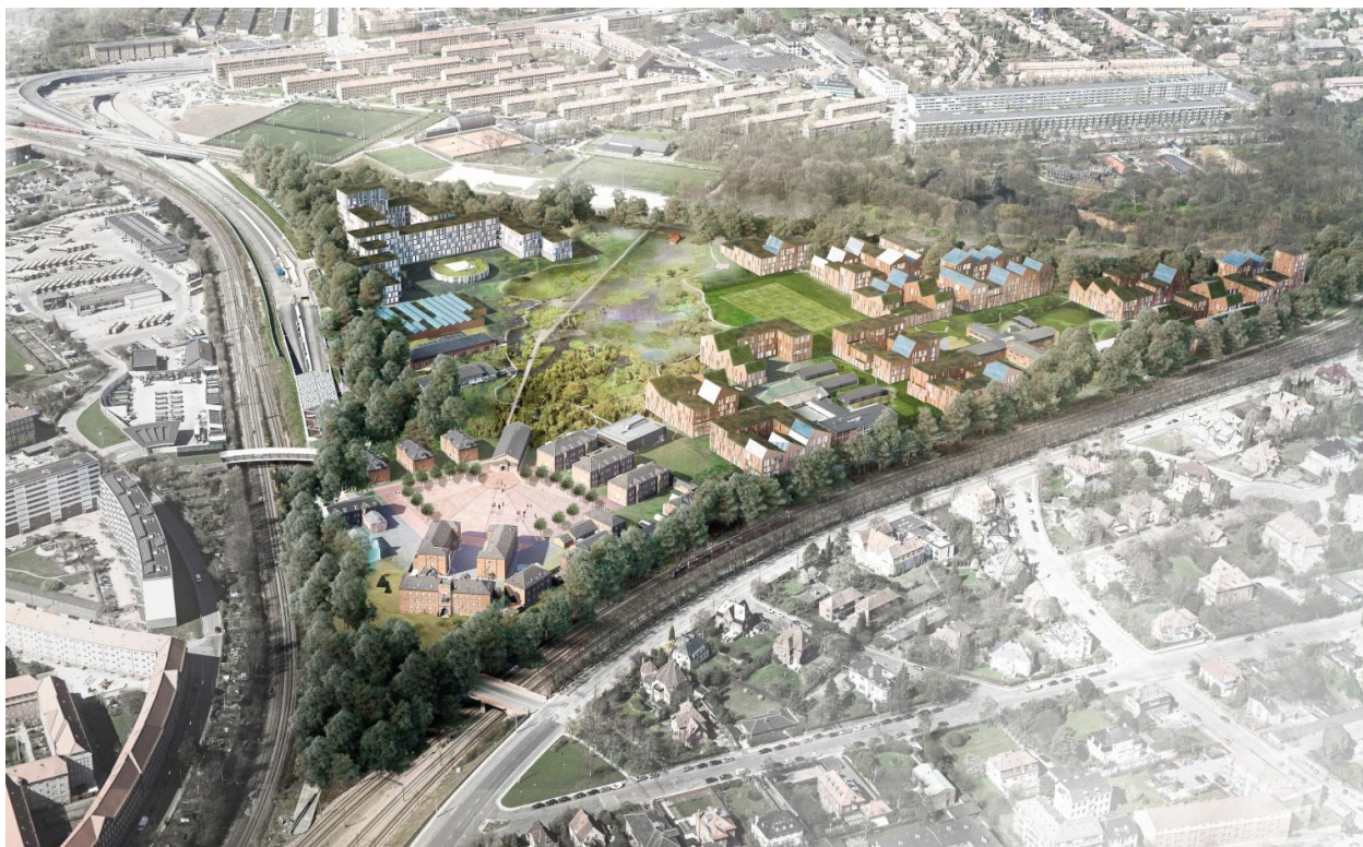
Illustration: Vinderen af Forsvarsministeriets Ejendomsstyrelse (FES) afholdte arkitektkonkurrence om helhedsplan for Svanemøllens Kaserne: Primus Arkitekter og STED by- og landskabsarkitekter

Der foreslås etableret stiforbindelse fra Ryvangsområdet, gennem kaserneområdet og videre via en stibro mod Borgervænget og Kildevældsparken.