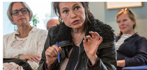
Fotos fra ALDER 3.0 kick-off event 21. maj 2016

Såfremt vi modtager udviklingsstøtte, vil vi løbende indberette resultater fra vores proces samt synliggøre Kultur & Fritidsforvaltningen med logo på alle platforme; dvs. PR- og markedsføringsmaterialer, pressemeddelelser, program og invitationer, hjemmeside og på Facebook - og gerne indgå i en dialog, om jeres forventninger.