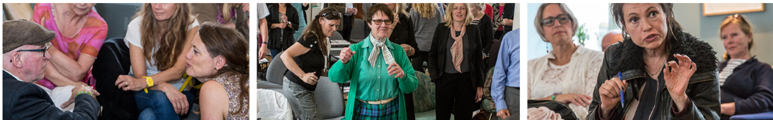
Fotos fra ALDER 3.0 kick-off event 21. maj 2016

Kultur & Fritidsforvaltningen Københavns Kommune