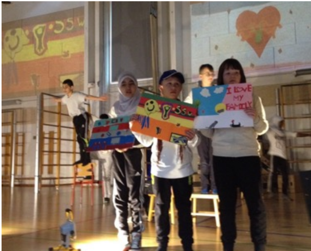
Tværkunstneriskforløb på Nørre Fælled Skole, marts 2016 – børnene optræder for deres kammerater og forældre

Ansøgning til Kultur- og Fritidsudvalget