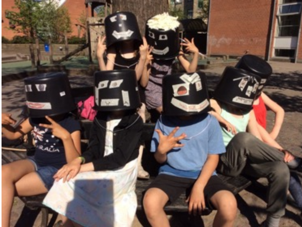
Hold på Rådmandsgade Skole øver forestillingen "Drømmebæster" som de optræder med til Københavns dukketeaterfestival for børn Puppets Junior; juni 2016.