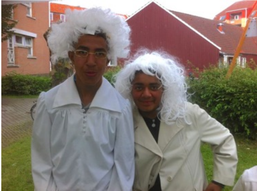
Opsøgende kunstprojektet "Det Mystiske Hotel" i Titanparken, august 2016