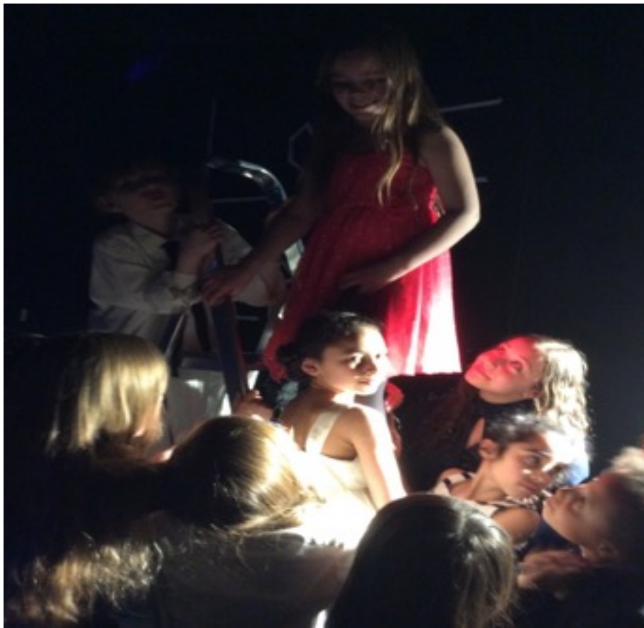
LOVE Nørrebro – forestilling til Kulturfestivalen 48Timer på teatergrads scene i Nørrebrohallen, maj 2016.