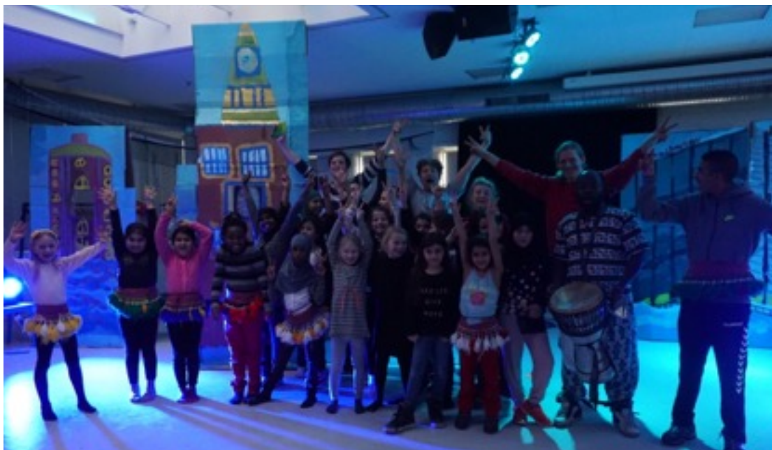
Forestilling "København under vand" til FerieCamp i Osramhuset, februar 2016

Ansøgning til Kultur- og Fritidsudvalget