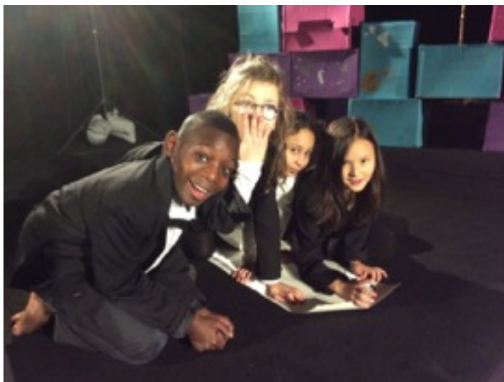
Forestillingen "Hvad du ønsker, skal du få" fremført i december 2015 på Teatergrads Scene i Nørrebrohallen som en del af kulturkalenderen 24 Dage med Kultur.