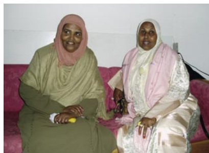
FESTKLÆDTE KVINDER TIL IKC'S EID UL-FITR FEST

Bestyrelsen og ledelsen håber også fremover, at det vil lykkes at bevare centret, så IKC fortsat kan være med til at gøre Danmark til et bedre land at leve i.