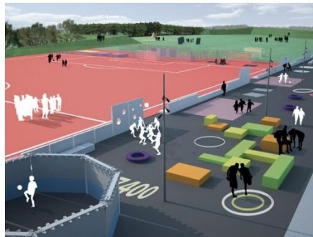
Fodboldeksperimentarium - Herning

Et fodboldareal åbnes op med aktivitetstilbud til flere brugergrupper. I ”Fodbolduniverset” omdannes et par traditionelle fodboldbaner til et samlingssted for en lang række fodboldaktiviteter og leg. Der etableres faciliteter til bl.a. nye