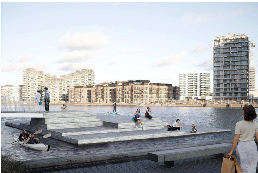
Figur 3 - Visualisering af træbryggen foran Myrholm set fra Lyngholm.