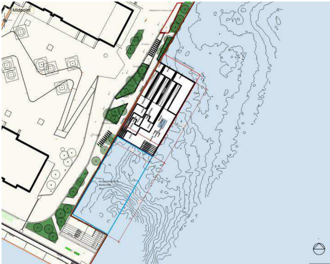
Figur 4 - Træbrygge foran Tangholm. Forberedt til badezone mod syd.

Da området syd for træbryggen foreslås som fremtidig badezone idet vandkvaliteten tillader at man bader, er træbryggen forberedt til at skabe adgang til vandet og forberedt til en badezone mod syd. Derved kan personer i badezonen svømme ca. 30m. beskyttet for havnebusser og fritidssejlere mellem den nye træbrygge og den eksisterende træbrygge mod syd. Mellem de to træbrygger monteres en flyde-line med gule bøjer, der markerer hvortil badezonen går og hvortil de sejlende skal stoppe.