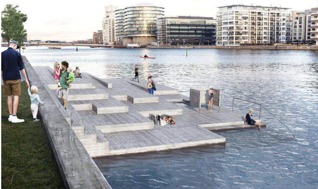
Figur 5 - Visualisering af træbrygge foran Tangholm.

I lokalplan 494 med tillæg samt kommuneplantillæg 31-36 er et område defineret (se figur 4/rød stiplet streg), hvor træbryggen placeres. Gennem udviklingen af projektet og efter konstruktiv dialog med grundejere og interessenter, foreslås det at placere træbryggen foran Tangholm fortrinsvis indenfor området men med et areal udenfor, hvorved der skal ansøges om dispensation.