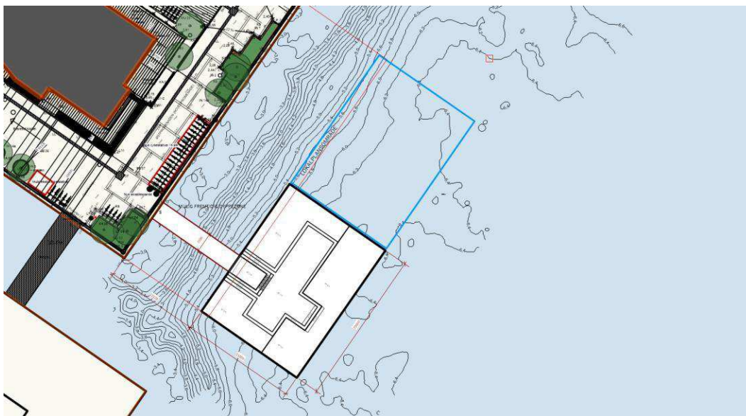
Figur 1 - Træbrygge foran Myrholm placeret som en ø - ude i havnen i øens syd- øst lige hjørne.

Træbryggen etableres som en Ø ca. 12m ude i havnen, med vand hele vejen omkring. Øen tydeliggøres yderligere ved en gangbro, som forbinder Myrholm med Øen. Gangbroen udføres i samme design, som broen ud til de nye havnebusstoppesteder ved Islands Brygge og Enghave Brygge for at skabe ensartethed og genkendelighed. Broen etableres uden søjler, så der er mulighed for roere til at sejle under