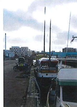
Billede: nuværende husbådesituation i Frederiksholmsløbet og Belvederekanlen.

Vi synes at en lukket broløsning går direkte imod Københavns Kommunes vision om havnens fremtid. KK efterlyser åbenhed og aktivitet og liv ved og på vandet, og man sammenligner området med Christianshavns kanaler og Amsterdam, da her kommer kanaler og der er allerede husbåde i området. Hvis man udelukker alternative boformer på vandet og mulighed for henlæggelse større skibe eller projekter i området, fjerner man automatisk muligheden for at opfylde visionen i det område. Derfor vil vi ikke anbefale at lave en lukket løsning på broen over Frederiksholmsløbet.