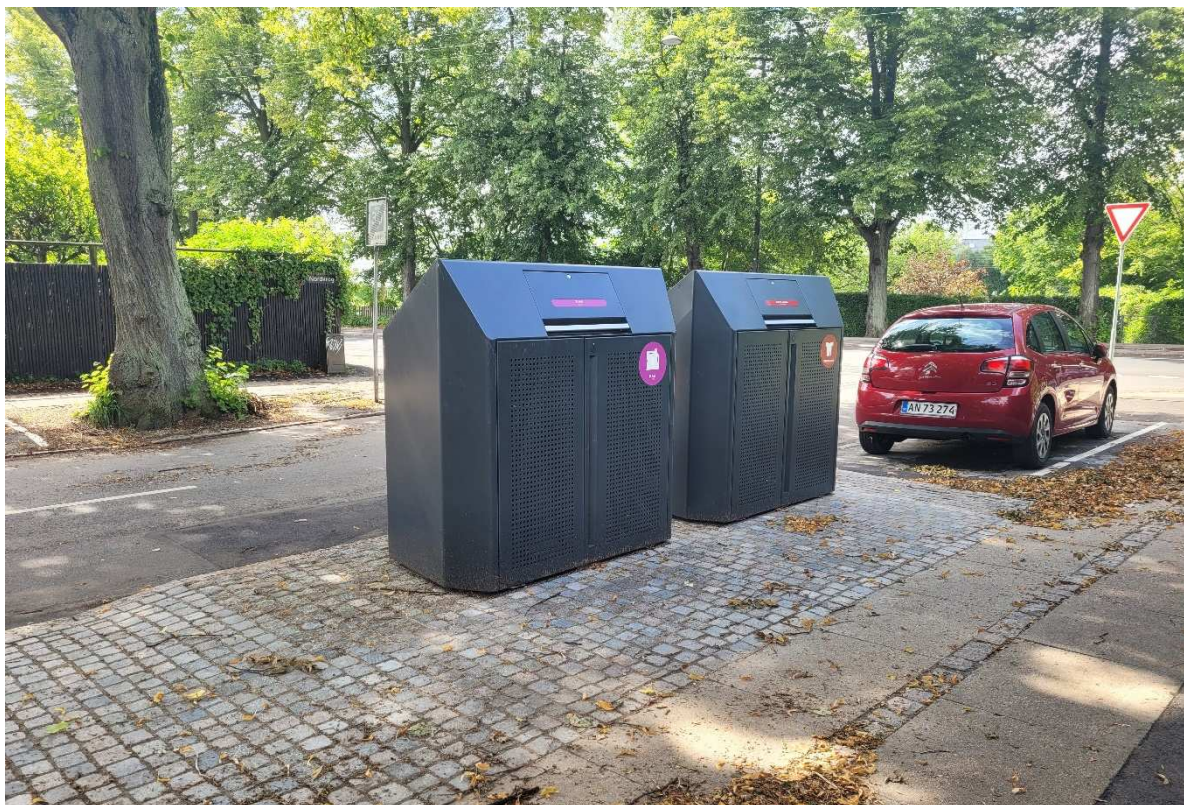
Eksempel på sorteringspunkt med to skjul på Østerbro.