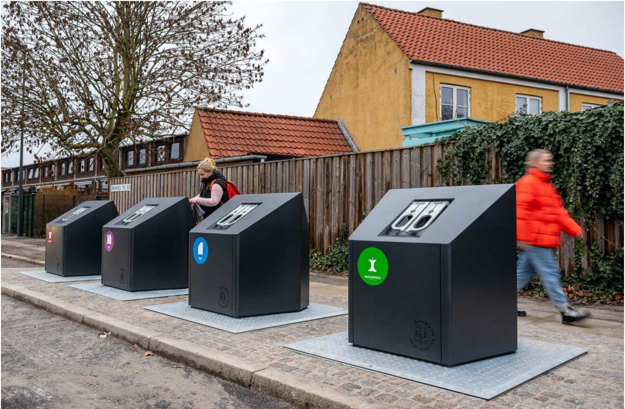
Sorteringspunkt i Amager Øst med fire nedgravede beholdere. Anlagt i januar 2023.