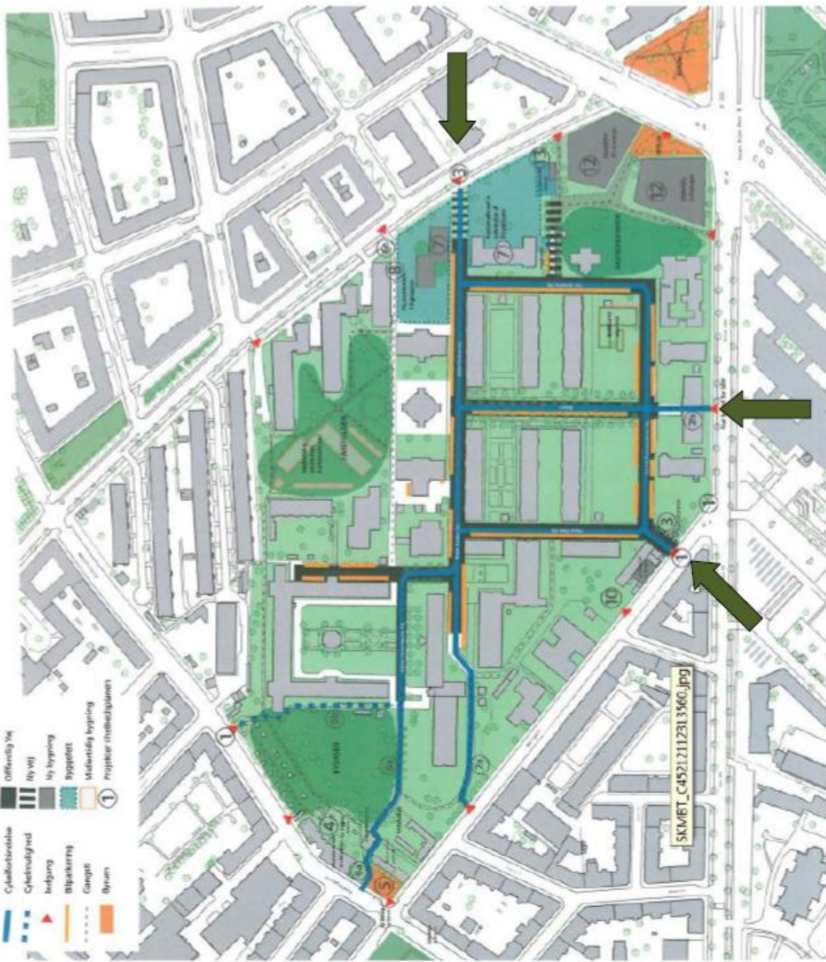
Helhedsplan for De Gamles By – kortbilag fra BR-beslutning 20.09.12