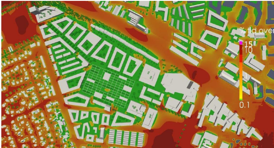
Figur 3. Vindforhold for området, beregnet med lægivende foranstaltninger i form af træer. Uddrag af vindanalyse udarbejdet af Vind-vind ApS, dateret 2014.11.05.

De steder hvor højhuse er integreret i karréer må det forventes, at der vil være en negativ effekt på vindklimaet i større dele af gårdrummet. Det kan være vanskeligt at udbedre et forringet vindklima i et gårdmiljø, men lægivende foranstaltninger, jf. figur 3, vil kunne bidrage til at skabe områder med et fornuftigt vindklima. Den negative effekt på vindklimaet kan reduceres ved at have relativt smalle højhuse og ved at minimere højdeforskellen på de enkelte bygninger i karréen.