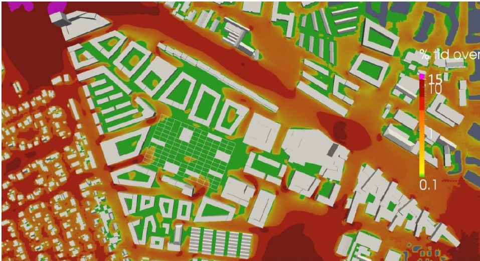
Figur 2. Vindforhold for området, beregnet uden lægigende foranstaltninger. Uddrag af vindanalyse udarbejdet af Vind-vind ApS, dateret 2014.11.05. Skalaen angiver den procentuelle andel af tiden, hvor vinden overstiger 6 m/s. Et miljø med 0,1 % tid over 6 m/s anses for acceptabelt til udeophold af længere varighed, mens 6% anses for acceptabelt til kortere ophold, 23 % til slentring og 43 % til hurtig gang.

Hvis man sammenholder områder, hvor der placeres højhuse og steder med aktive facader ser det ud til at være et sammenfald nogle steder.