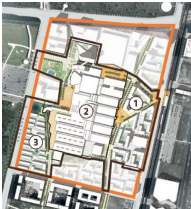
Figur 1 Lokalplanområdet Kvarteret ved Bella Center. Den sorte streg afgrænser lokalplanområdet. Illustration fra lokalplanen

Det ansøgte område dækker lokalplansområdet og omfatter ifølge denne en del af ejendommen matr. nr. 146 samt umatrikulerede arealer (offentlig vej), Eksercerpladsen, København, og alle parceller, der efter 1. februar 2014 udstykkes i området.