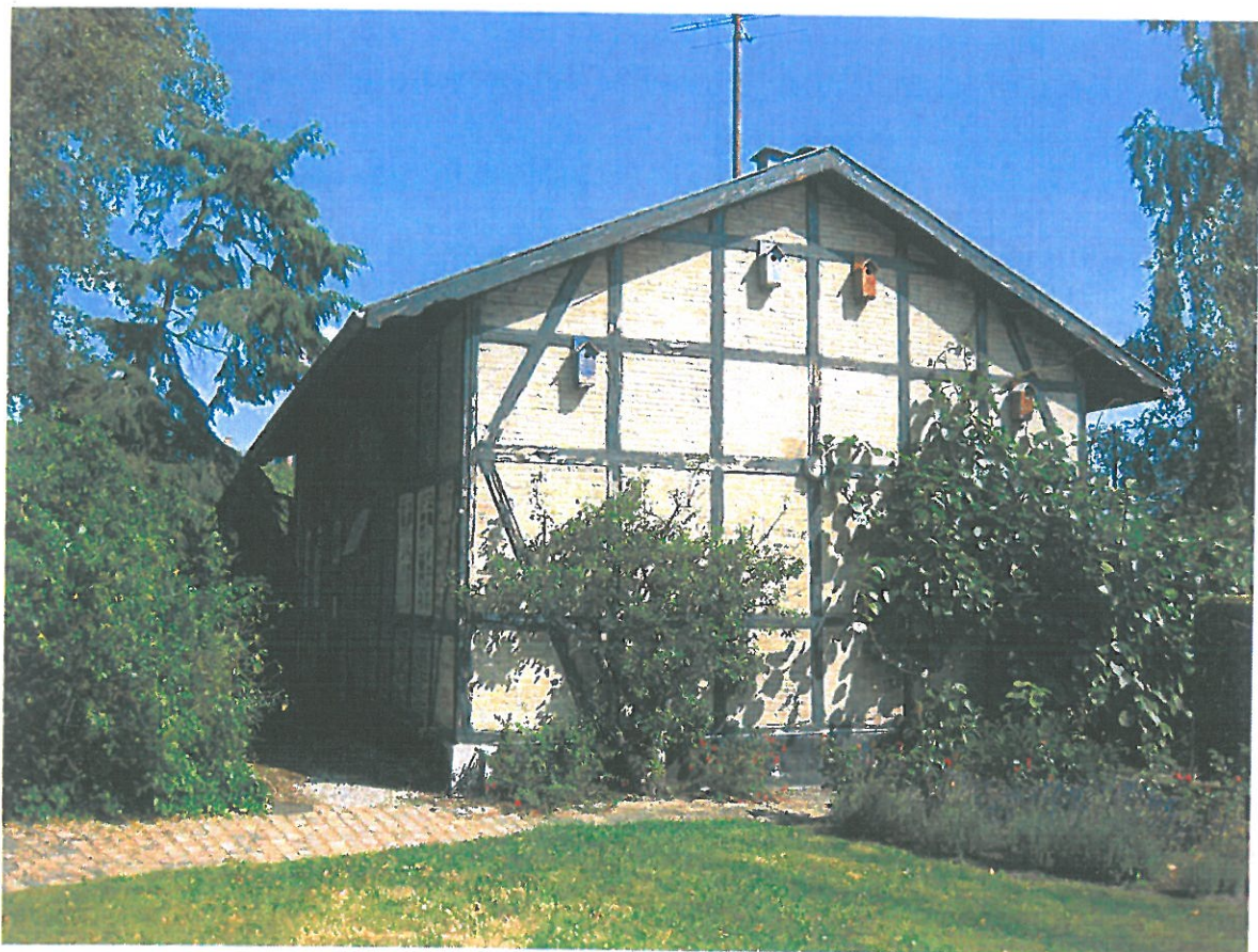
Fotos af Tennisklubhuset.