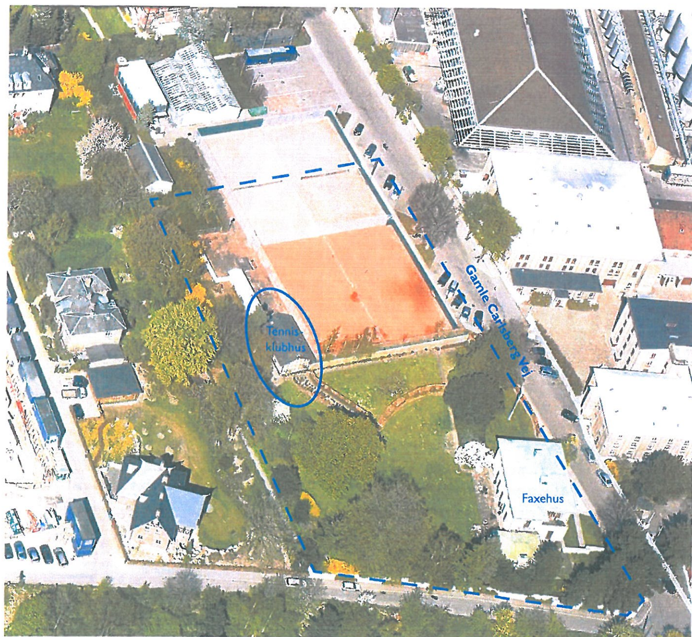
KRAK skråfoto. Markering af Tennisgrunden og af klubhuset, der søges om tilladelse til at nedtage og genopføre.