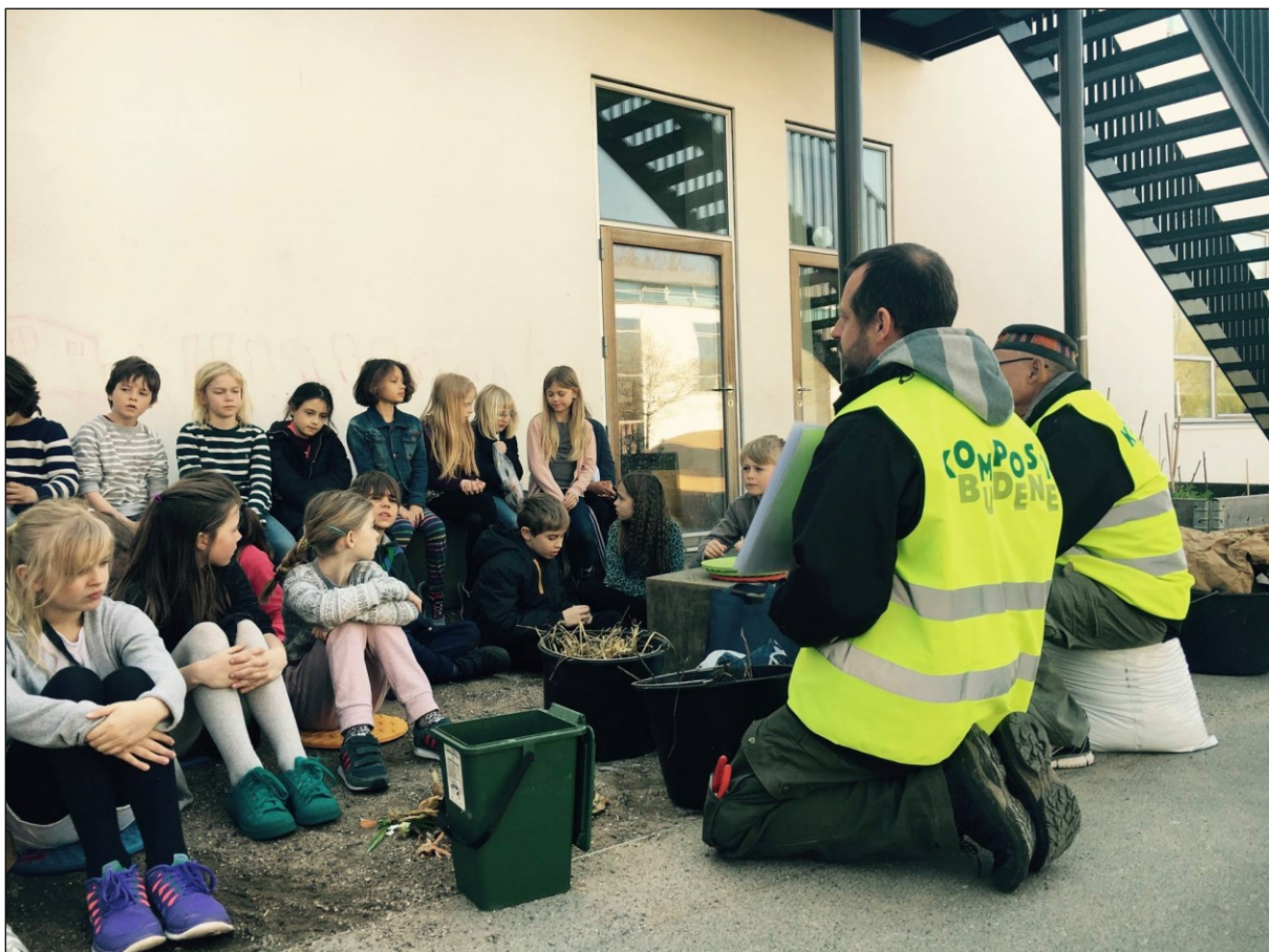
Undervisning om ressourcekredsløb og kompostering med Kompostbudene

Det er tydeligt at byttemarkeder for alvor er kommet for at blive. Der er på Amager en stor efterspørgsel efter byttemarkeder og lignende faciliteter som gør det muligt for borgerne at recirkulere og dele deres udtjente og brugte ejendele. I løbet af 2016 har Miljøpunkt Amager afholdt to byttemarkeder, samt en række mindre arrangementer med fokus på genbrug og genanvendelse.