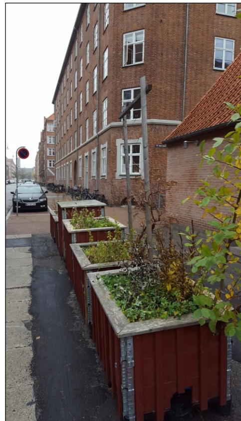
Gadehaver på Ungarnsgade

Som opfølgning på Park in a Week i 2015 på Prags Plads, hvor vi var i dialog med beboere og forbigående, havde vi i 2016 fokus på at realisere nogle af de konkrete ideer og forslag som der blev diskuteret. Blandt forslagene var bedre afmærkning af gå og cykel område, mulighederne for at skabe ophold med bænke, flere aktiviteter, plantekasser i forbindelse med cykelstativ samt kunst.