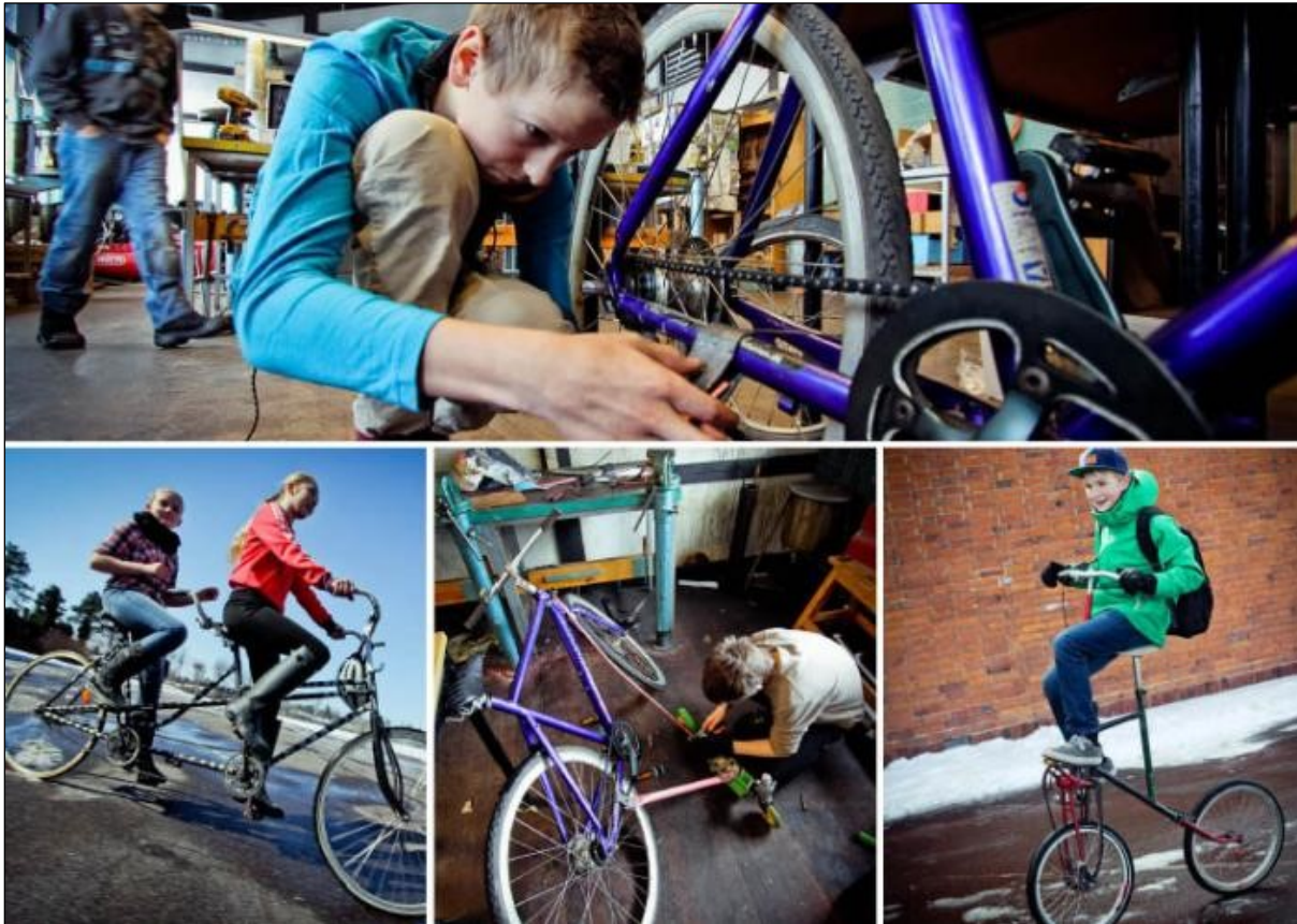
Billeder fra undervisningsforløbet Cykelbyg & Design.

Vi har i øvrigt haft fokus på at undervise børn ved åbningen af Trafiklegepladsen og ved workshop om cykelvedligeholdelse den 28. april.