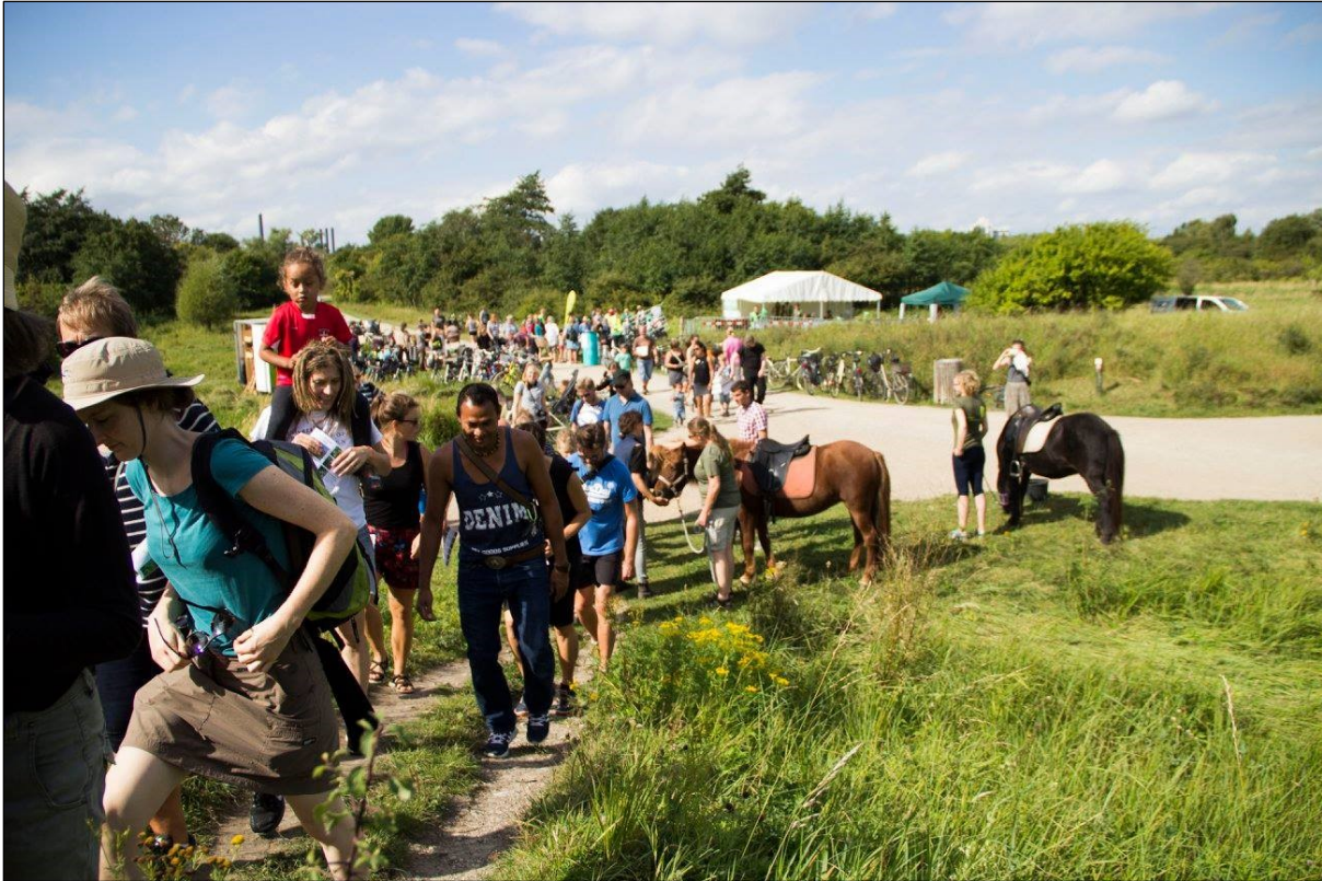
Fælledens dag.

Dagens mange aktiviteter blev gennemført med hjælp fra frivillige fra Danmarks Naturfredningsforening København, Københavns Kogræsserlaug, Amager Fælleds Venner, Planteklubben, Solvang Bi-gaard og Madskolen Jorden Rundt.