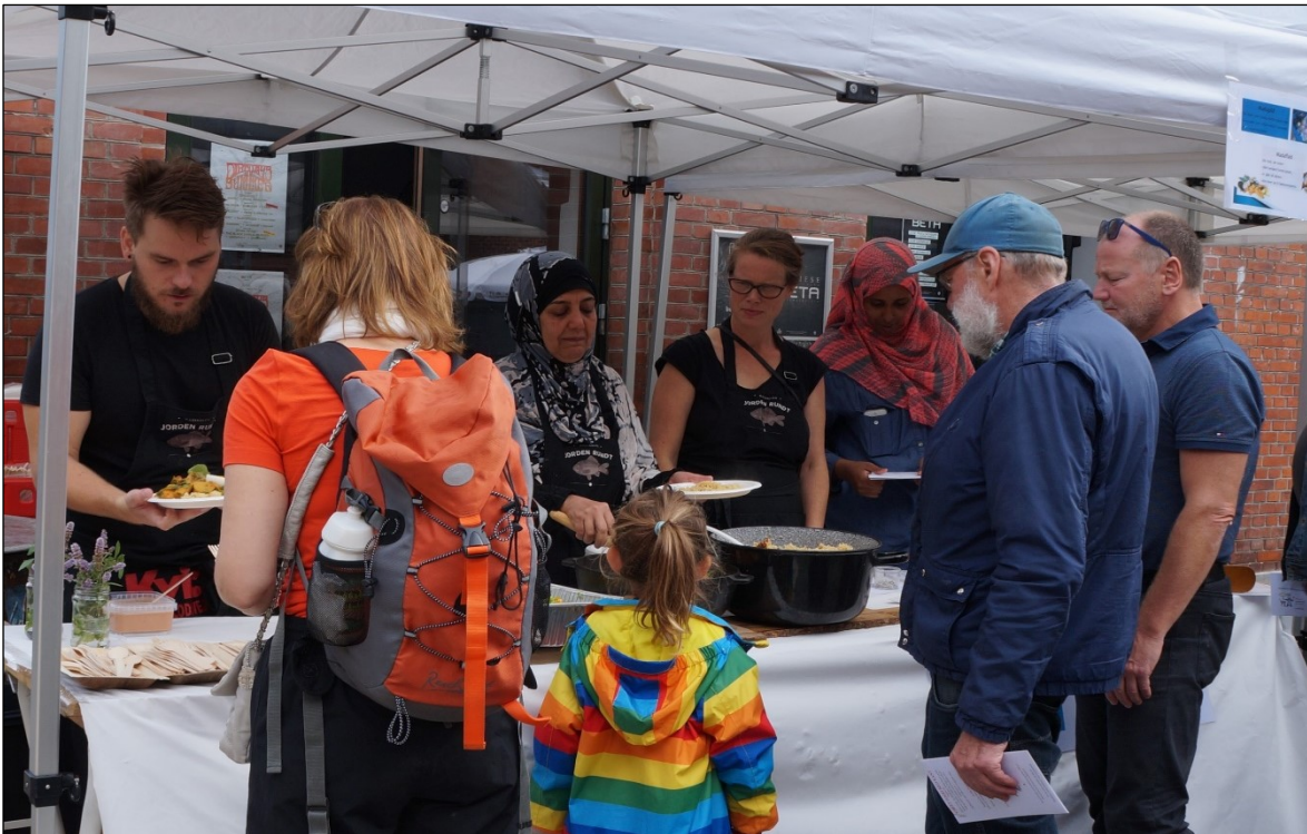
Streetfood på Lørdag på Musiktorvet.

Derudover kunne besøgende få inspiration hos Miljøambassadørerne og Kompostbudene om hvorledes man kan minimere madspild, samt opstarte kompostering der hvor man bor.