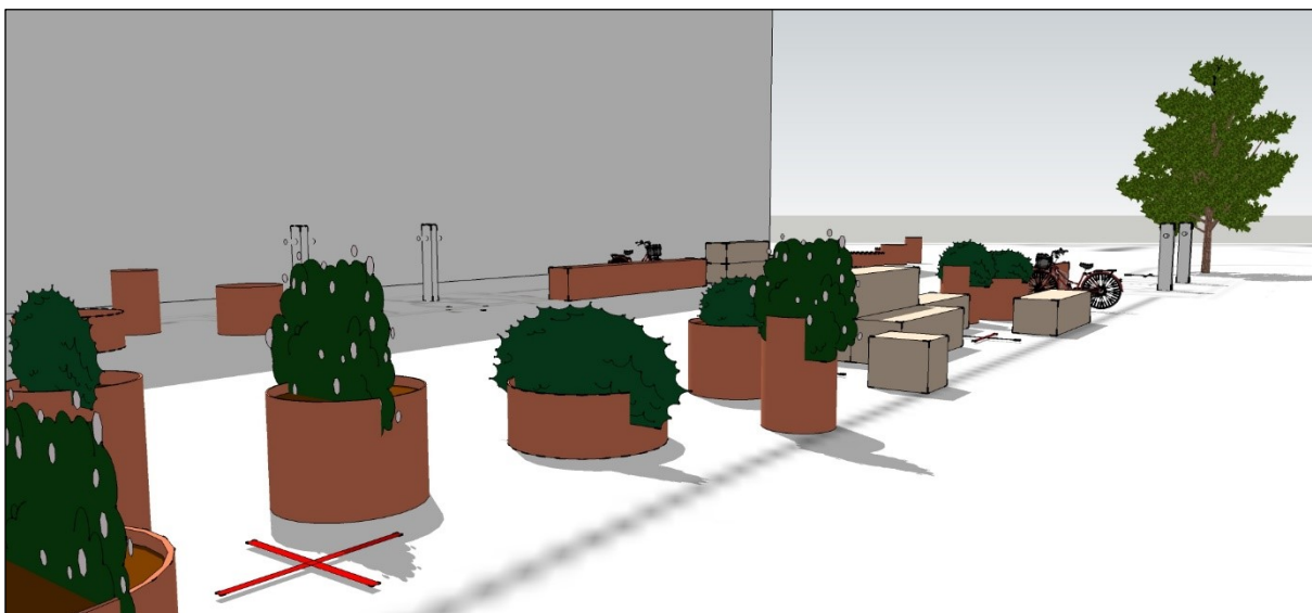
Illustration af elementer i Grønt strøg på Isafjordsgade. Lasse Schelde

Desværre lykkedes det ikke at skabe politisk opbakning til at afsætte kommunale budgetmidler til etableringen af det grønne strøg, men der har fra politisk hold, været udtryk interesse for planerne.