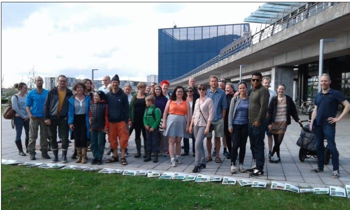
Guidet tur til Spiselige planter på Amager Fælled.

På den første offentlige tur den 29. april deltog over 80 mennesker. Turen var en succes, selvom det høje deltagerantal vanskeliggjorde formidlingen undervejs. Til den anden offentlige tur den 29. juni blev der af hensyn til formidlingen indført deltagerbegrænsning. Der deltog 30 mennesker i turen og mange ønsker om deltagelse måtte afvises.