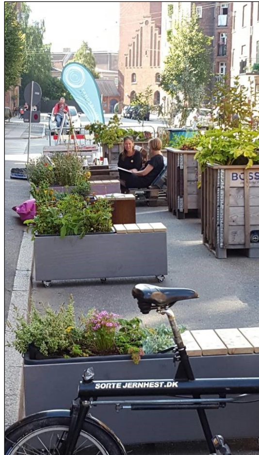
Park(ing) Day.

Isafjordsgade: I samarbejde med initiativet Grønnere Bryggen arrangerede vi en lokal Park(ing) Day på Isafjordsgade. Formålet med arrangementet var at understøtte det lokale arbejde for et grønnere Islands Brygge, som særligt Islands Brygge Lokalråd i en længere periode har haft fokus.