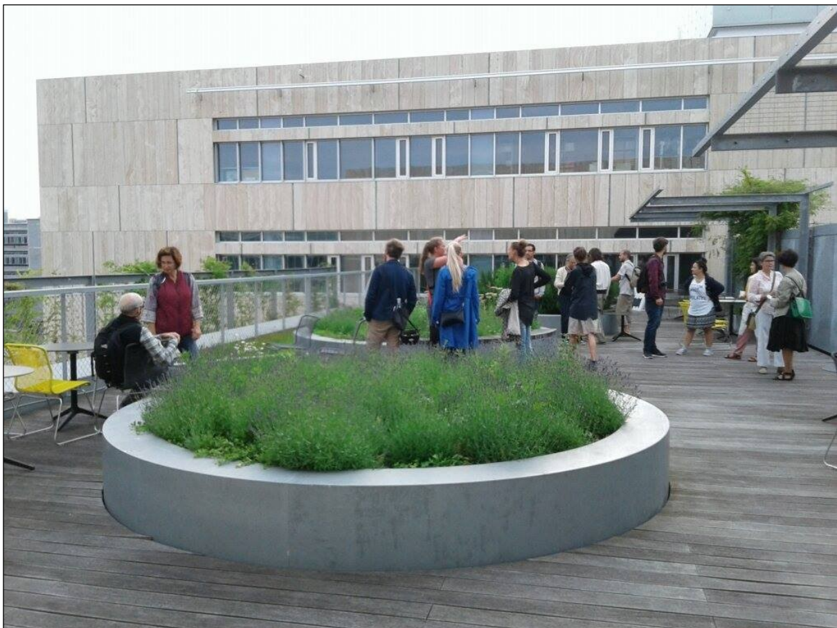
Guidet tur til Ørestads skjulte taghaver.

Den guidede tur den 22. juni var helt fyldt op 23 deltagere. Vi besøgte grønne tage i boligforeninger, parceller, cykelskure og institutioner i Ørestad Nord.