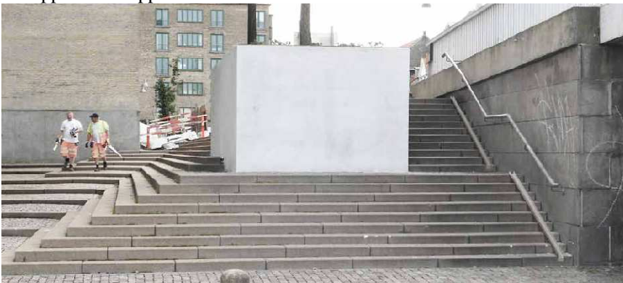
Foreløbig visualisering af løsning med slisker.

Løsningen for arealet består i at udskifte et spor i den eksisterende brostens belægning under Knippelsbro. De kløvede brosten udskiftes med nye savskårne og stokhuggede brosten, efter samme princip som er anvendt på strækningen imellem Knippelsbro og den kommende Cirkelbro. Derudover etableres der metal slisker op af trappen til Knippelsbro.