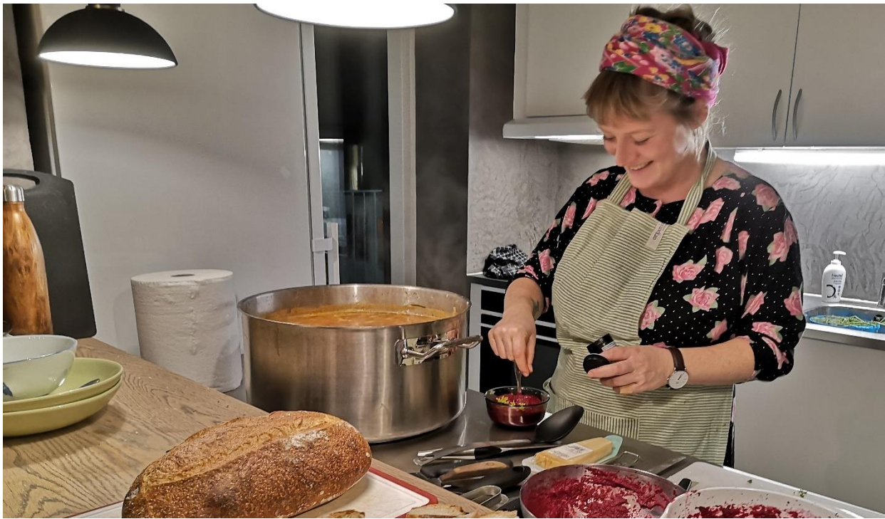
3. Klimakærlig mad, Gulerodskrigeren i køkkenet