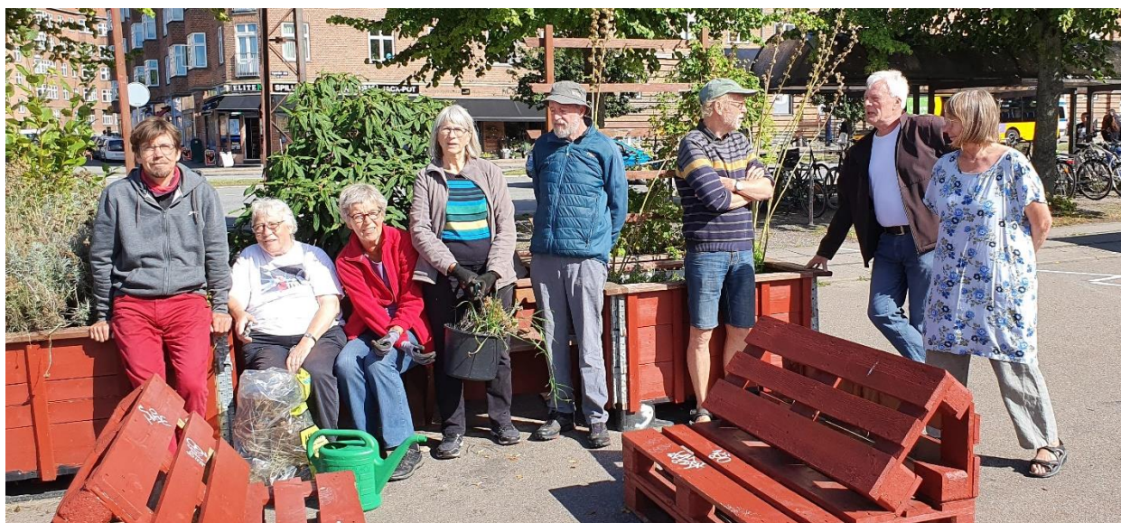
1. Aktive i Valby Miljøgruppe

Coronakrisen kan forventes i lang tid endnu at lægge hindringer for mange af vore gængse måder at møde borgerne. Vi vil stadig planlægge fysiske aktiviteter, men i det omfang restriktioner begrænser dette, vil vi udvikle andre måder at oplyse og inspirere på. Vi vil bl.a. optage korte lokale film, der kan illustrere klimaproblematikkerne med billeder og vinkler fra Valby