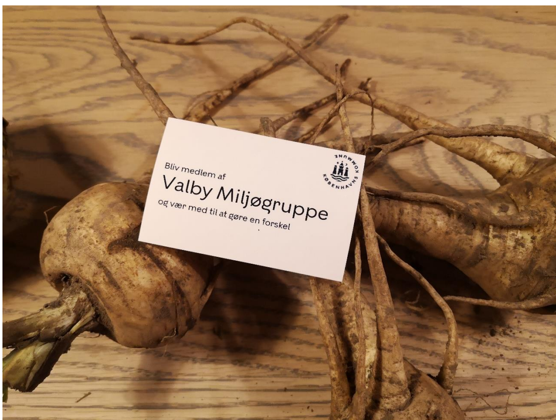
4. Valby Miljøgruppe er åben for alle der ønsker at gøre en forskel for miljø, klima og natur i Valby

Sekretariatet varetager udlån af en ladcykel og en æblepresse til borgere i Valby. Æblepressen for at støtte op om indsatsen mod madspild og synliggøre potentialet for at dyrke i byen. Ladcyklen udlånes for at gøre opmærksom på alternativer til biltransport.