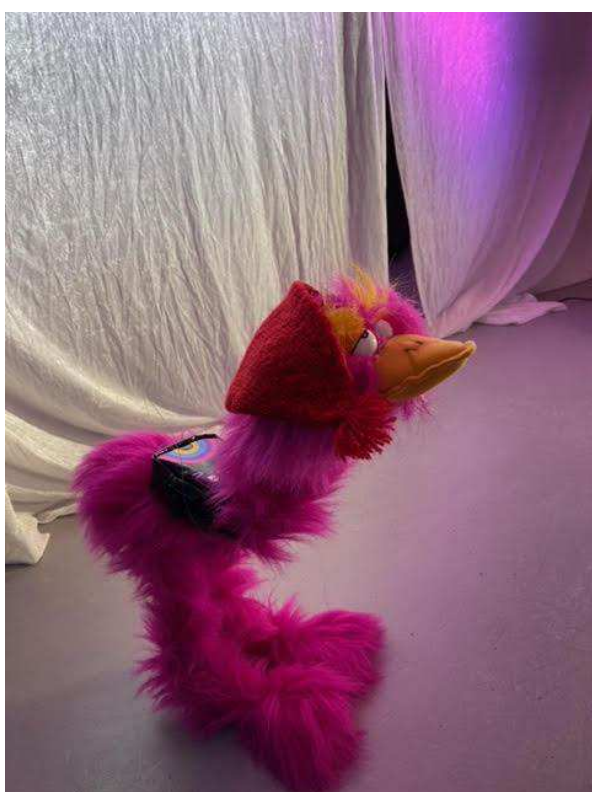
Her ses fuglen Pippin med sin ikoniske taske