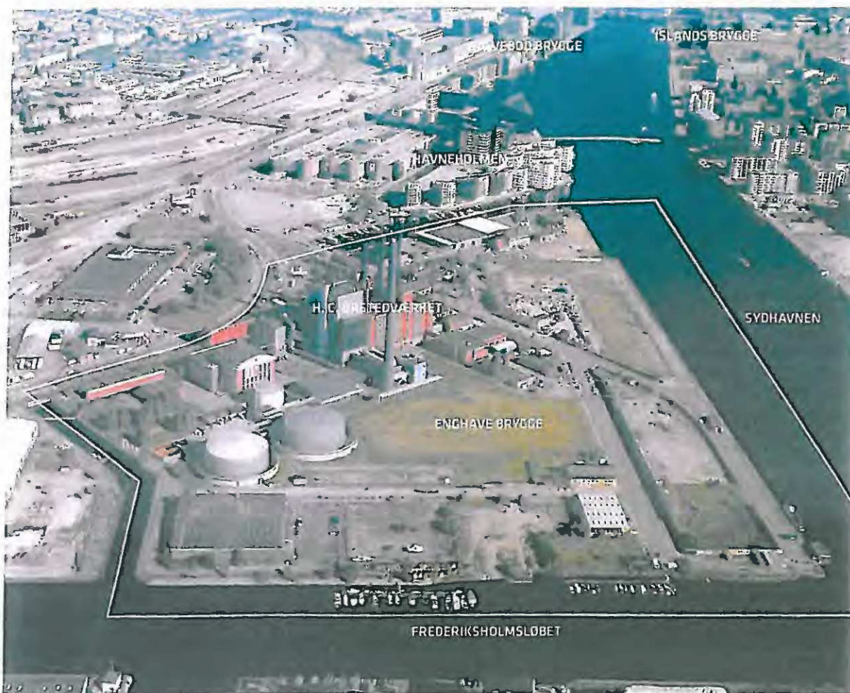
Luftfoto af Enghave Brygge set mod nord. Havneholmen, Fishetorvet, Kalvebod Brygge, banearealerne samt Islands Brygge ses i baggrunden.