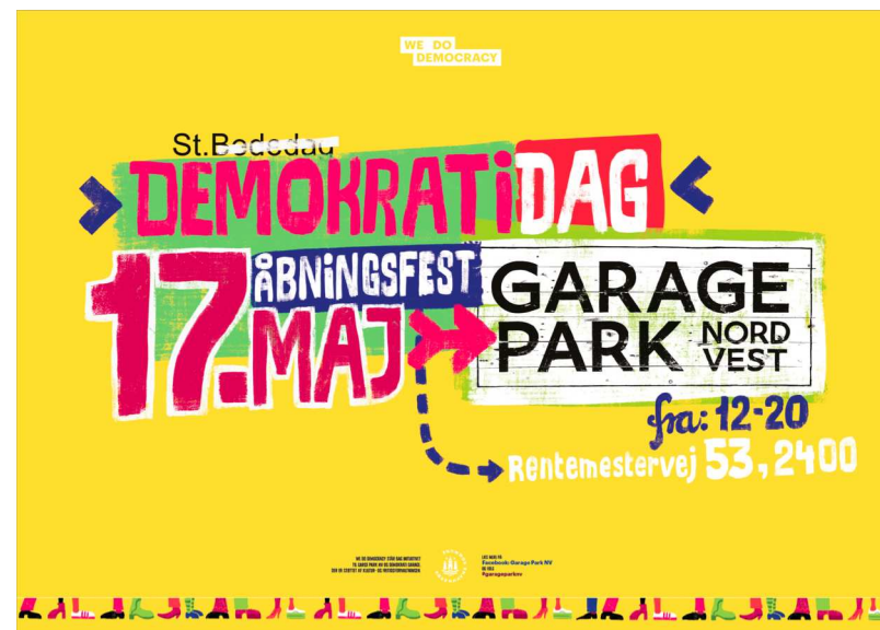
Plakat fra åbningsdag, Garage Park og Demokrati Garage i NV

Demokrati Garage skal i hjertet af Nordvest styrke byens demokratiske lederskab, værtsskab og fællesskab. Med etableringen af et mødested for demokrati i Nordvest skal Demokrati Garage accelerere aktiviteter, etablere organisation og sikre en bæredygtig økonomi frem mod 2022.