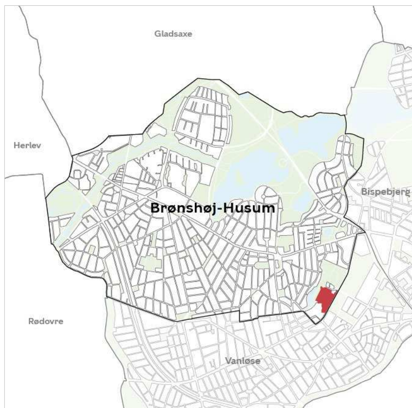
Områdets placering i bydelen.

Den almene boligorganisation SAB har anmodet forvaltningen om et nyt plangrundlag, som muliggør nedrivning og genopførelse af de 10 højhuse, som udgør den almene boligafdeling SAB Bellahøj I og II. Ønsket skyldes at SAB har erfaret, at der er så alvorlige konstruktionsfejl på de 10 højhuse at det ikke økonomiske kan svare sig at renovere husene, og at det ikke vil kunne holdes inden for Landsbyggefondens rammer.