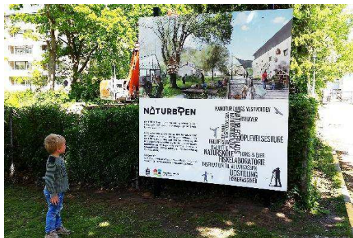
Figur 2. Præsentation af Naturbyen 2016