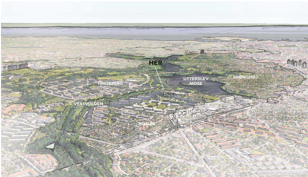
Figur 1. Illustration af naturcenteret/naturværkstedets placering i forhold til byområder og naturområder. Grafik: Elzéline Van Melle