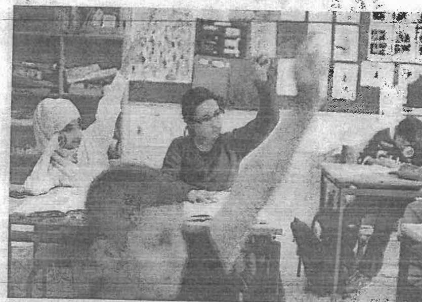
Modersmålsundervisning kan forbedre tosprogede elevers evner i dansk.

I et forsøg på at støtte minoritetsbørn i deres skolegang har man blandt andet i USA lavet store forsøg med undervisning på modersmål. Det har for eksempel været i form af at undervise spansk-talende børn på spansk – også i fag som matematik og historie – igennem hele deres skoleforløb, samtidig med at man har undervist i engelsk som andetsprog. Dermed kommer modersmålet i brug på mere abstrakte måder, end det gør derhjemme. Forskning over mere end tre årtier tyder på, at man med den-