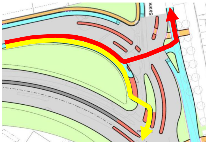
Figur 2: Det udbudte projekt - cyklisters krydsning af Strandvænget/Strandpromenaden i retning mod Svanemøllestranden (rød) og Kalkbrænderigade (gul).

Det anbefales at anvende det udbudte projekt, idet cyklister mod Svanemøllestranden eller Kalkbrænderigade her kun skal krydse Strandvænget/Strandpromenaden halvt så mange gange - henholdsvis 1 og 1½ gang.