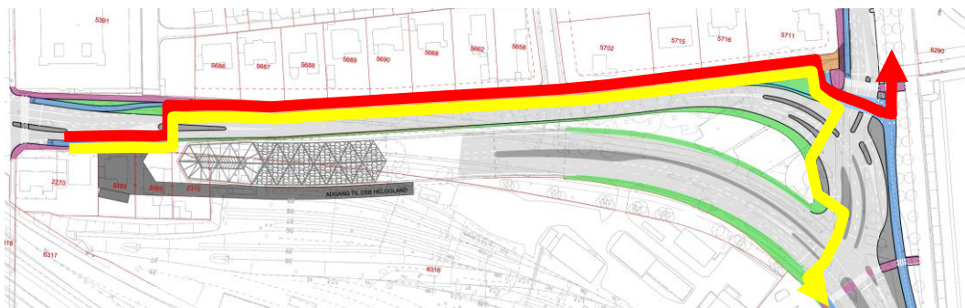
Figur 1: Ved lokalvej - cyklisters krydsning af Strandvænget/Strandpromenaden i retning mod Svanemøllestranden (rød) og Kalkbrænderigade (gul).

Cyklister der kører ad Strandvænget i østlig retning mod fx Svanemøllestranden eller Kalkbrænderigade har en øget uheldsrisiko idet de skal krydse Strandvænget/Strandpromenaden henholdsvis 2 og 3½ gange.