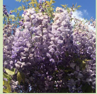
Slyngplante muligheder - alt efter sol- og skyggeforhold.