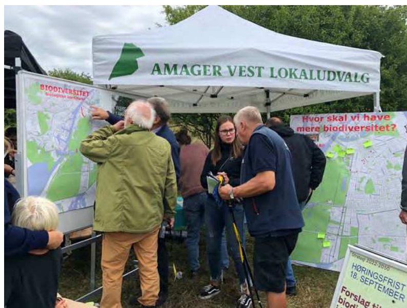
Fra Fælledens Dag 11.9.22

Her på den korte bane deltog lokaludvalget i orienteringsmødet d.1. september og borgermødet d.13. september 2022.