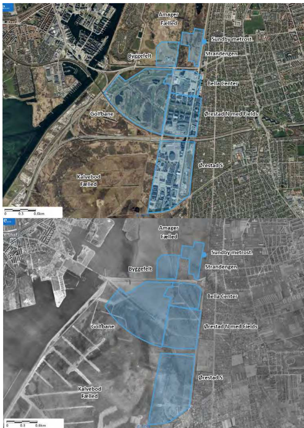
Figur 1. Placeringen af byggefeltet for Fælledby, det tidligere byggefelt på Strandengen, Sundby metrostation, golfbanen, Bellacenter og Ørestad i det en gang sammenhængende naturområde mellem Stadsgraven og Aflandsbage (Amager Fælled og Kalvebod Fælled) på baggrund af luftfoto 2020 og 1954.

at genoprette en mere naturlig hydrologi og at gennemføre helårsgræsning, med mindre stien hæves op på piller, der er høje nok til at kvæg og heste kan gå under. Kunstlys i stort omfang kan potentielt have negative effekter på natflyvende insekter og flagermus.