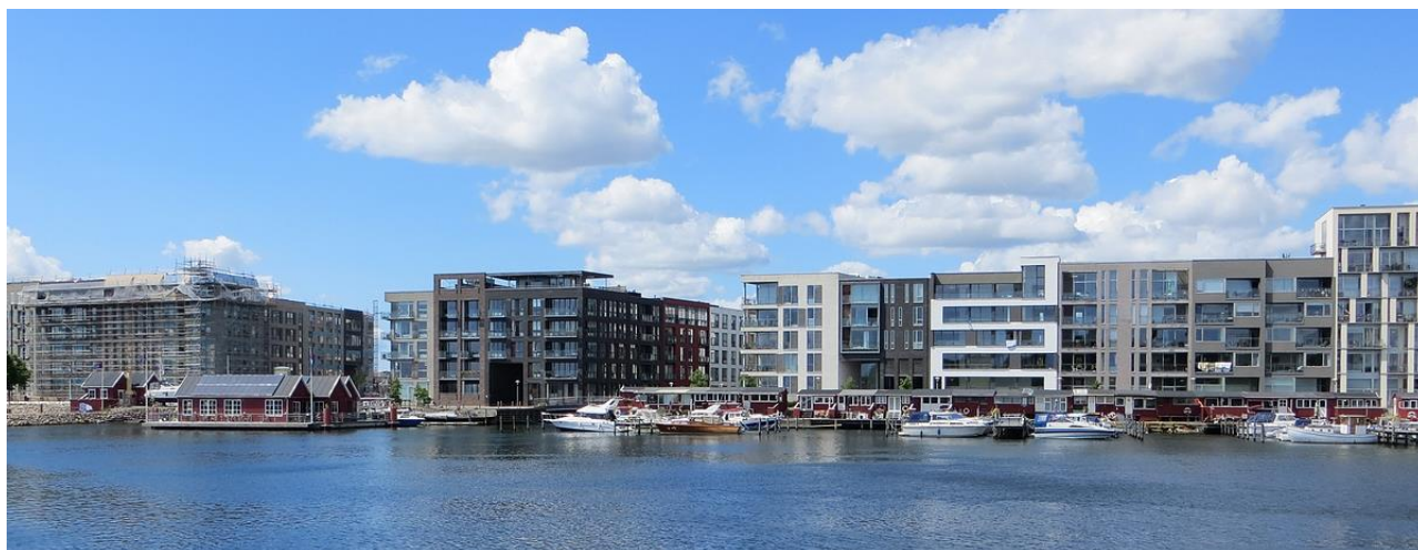
Bådklubben Valby, 2015 - Klubhus til venstre, bådschure til højre

Bådklubben Valby søger derfor midler til at finansiere disse tre flydebroer. Pris ½ mill. stykket, dvs. et finansielt behov på i alt 1 1/2 mill. kr. Midler klubben ikke selv kan finde eller forsikre sig ud af, hverken som lån eller over medlemmernes kontingenter. Hidtil er det lykkedes at selvfinansiere to flydebroer og indarbejde renoveringen af en fastbro langs klubbens bådschure i klubbens årlige budgetter. Udgifterne til de tre nye flydebroer skal skaffes via eksterne midler, gerne via en eller flere velvillige fonde, der kan se mening i at støtte vores ikoniske kulturarvs udnævnte bådklub.