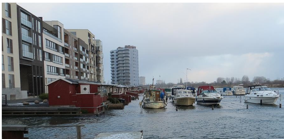
Bodil dec. 2013. Bådklubben set fra klubhuset. Broerne er helt væk. Foto er taget før maksimal vandstigning.

De efterhånden tilbagevendende oversvømmelser tærer kraftigt på træbroerne, som under normale omstændigheder har en holdbarhed på 10-15 år. Når oversvømmelserne hænger, oplever vi fare for motorbåde, der dør med trosserne og enten hiver i den faste bro, kommer i klemme under broen eller at broen i sig selv belastes af vandmængdernes tryk fra oven og fra neden. Samtidig bliver el installationerne ødelagt. Broerne bliver jævnligt oversvømmet, senest flere gange ultimo 2016 (Urd bl.a.). De normale vandstigninger eller -fald er på 20-40 cm, som sætter hyppige vandstigninger på over en meter i relief. Sluseområdet og den sydlige del af havnen virker som en tragt og er yderst påvirkelig for vandophobninger i havnen.