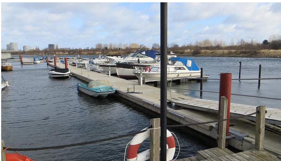
Den nuværende sydlige flydebro:

BKV har indhentet tilbud på tre nye flydebroer. Tilbudene bliver vedhæftet, når de er indkommet.