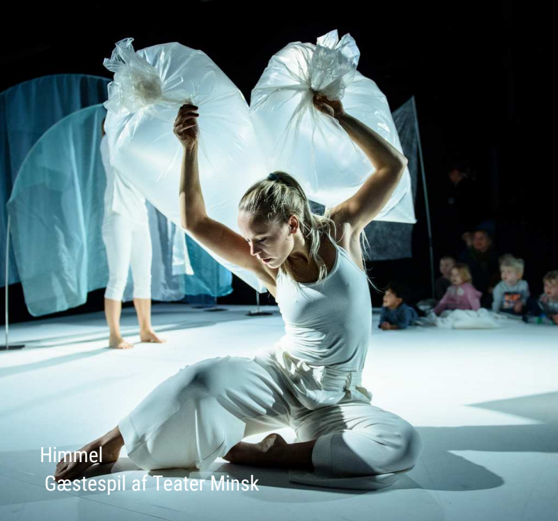
Himmel Gæstespil af Teater Minsk