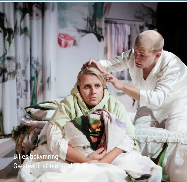
Billes bekymring Gæstespil af teater [døgdil]