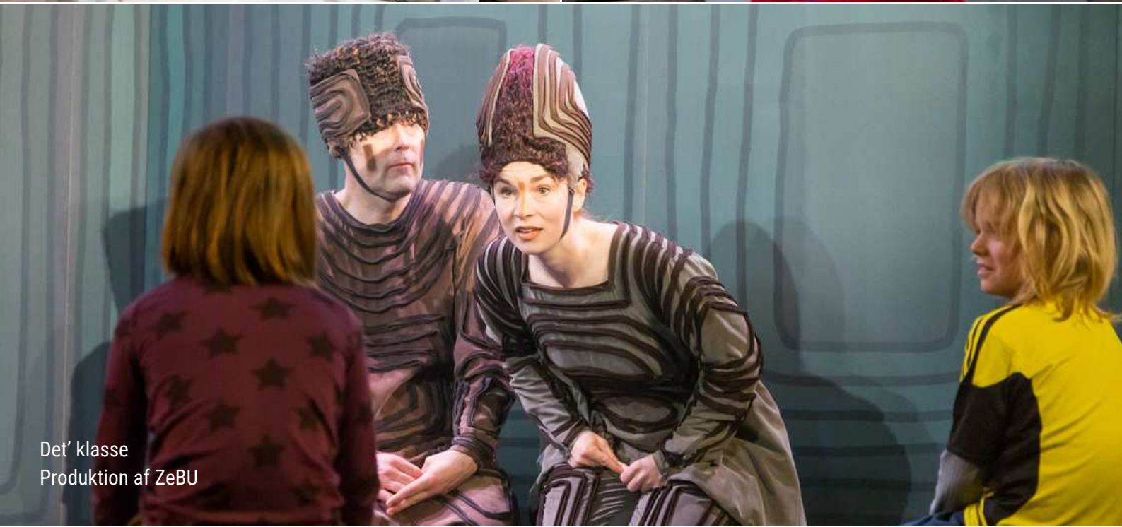
Det' klasse Produktion af ZeBU