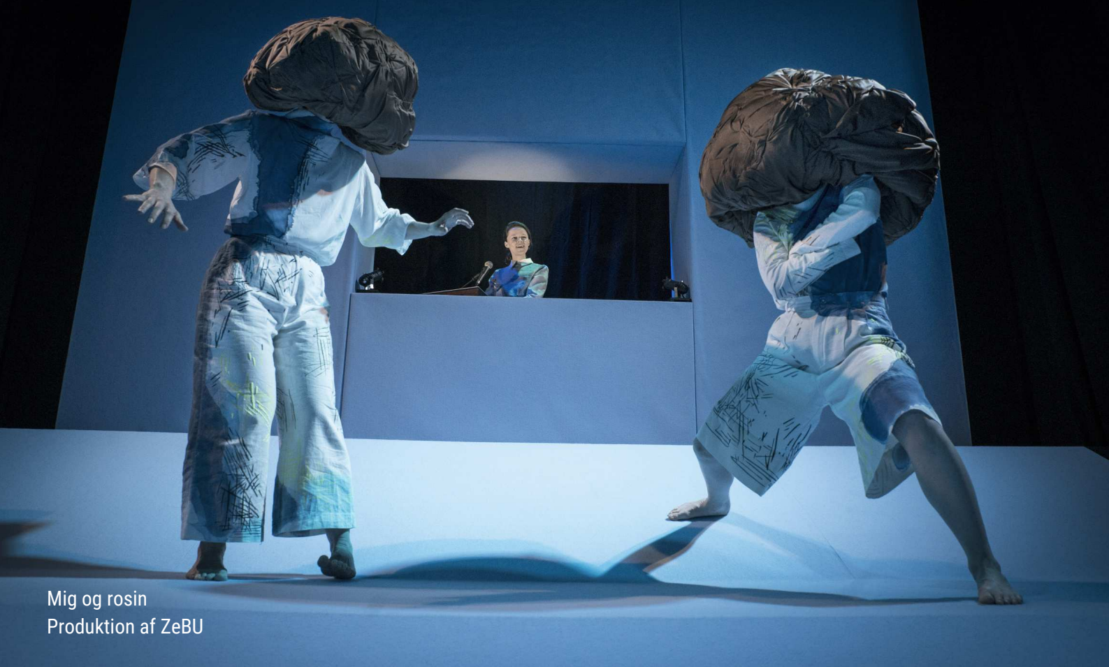
Mig og rosin Produktion af ZeBU