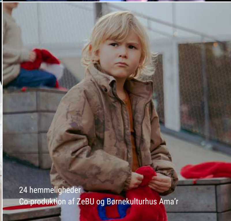
24 hemmeligheder Co-produktion af ZeBU og Børnekulturhus Ama'r