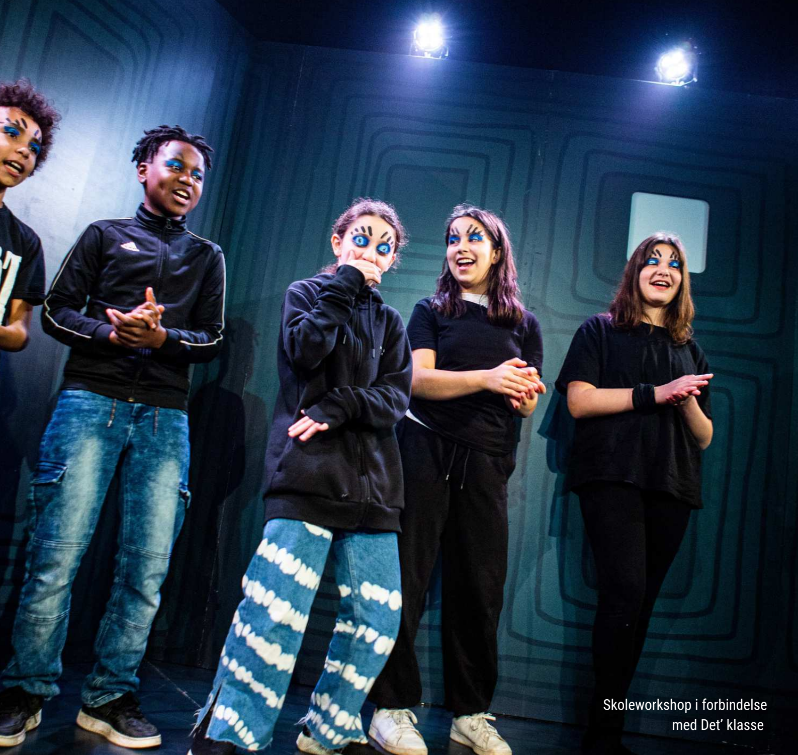
Skoleworkshop i forbindelse med Det' klasse