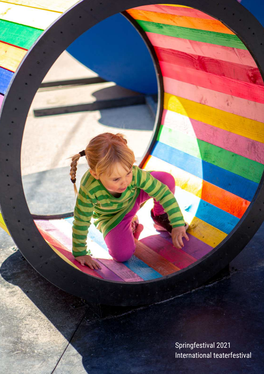
Springfestival 2021 International teaterfestival