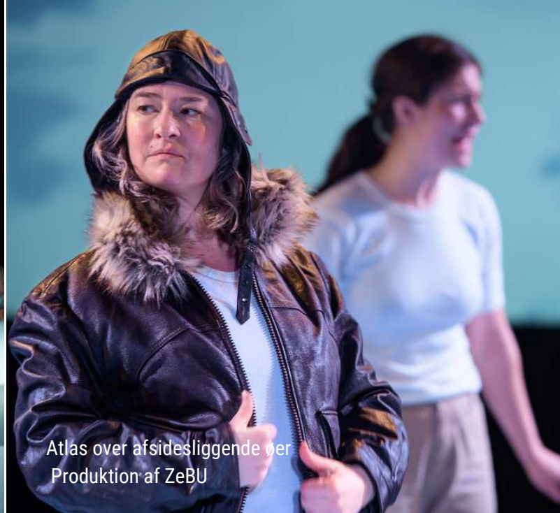
Atlas over afsidesliggende øer Produktion af ZeBU