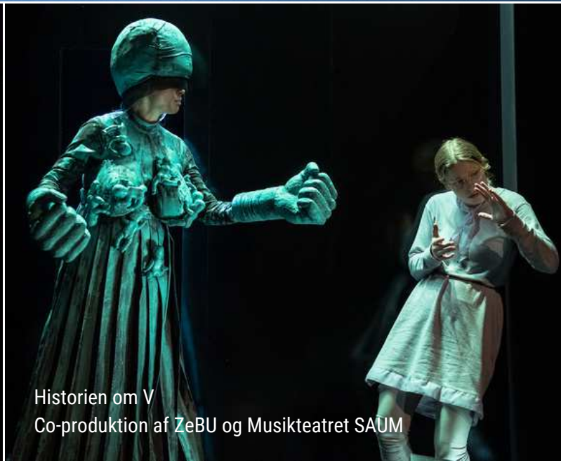
Historien om V Co-produktion af ZeBU og Musikteatret SAUM