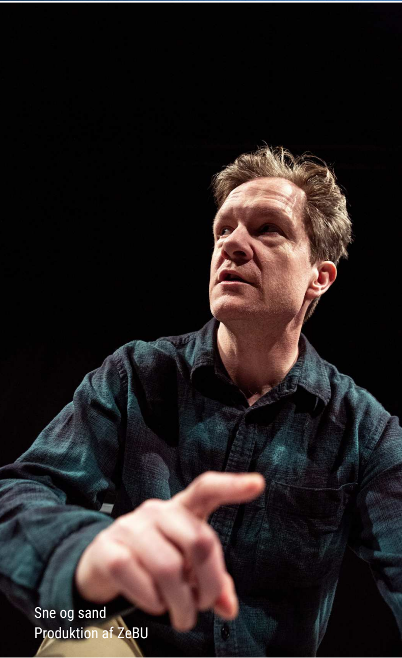
Sne og sand Produktion af ZeBU