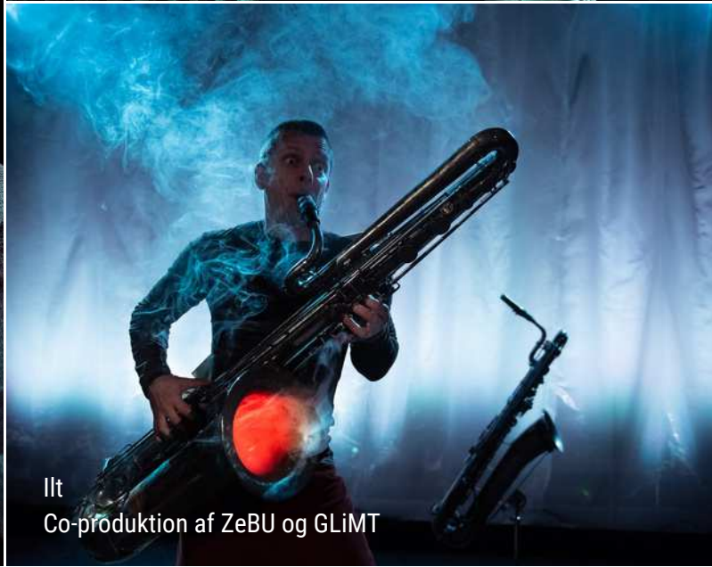
Ilt Co-produktion af ZeBU og GLiMT