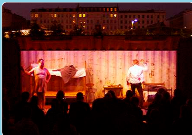
Edderkoppekvindens Kys 2 (2011) opført på Israels Plads og i Kødbyen i en 20-fods mobil container-scene.

Siden 2012 har teatret opført forestillinger på andre teatres scener i København, site-specific, på gaden eller i parker og rundt på skoler/uddannelsesinstitutioner. Samlet har vi spillet 78 forskellige steder i Storkøbenhavn, hvor størstedelen af spillestederne er folkeskoler.